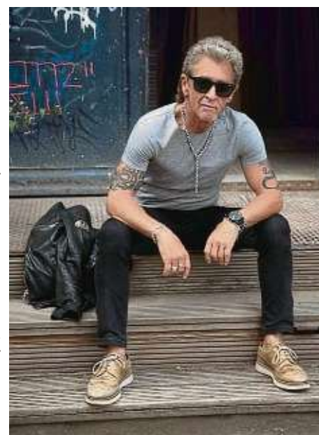
Die Rock-Legende kommt open Air nach Frankfurt: Peter Maffay.

amerikanischen Sängerin Anastacia, die mit „I'm outta Love“ im Jahr 2000 bekannt wurde. Halt macht die singende Ikone auch in Frankfurt: Am Donnerstag, 18. Juli, ab 20 Uhr im Deutsche Bank Park, Mörfelder Landstraße 362. Tickets zu ab 74,95 Euro gibt es online auf eventim.de und an den bekannten Vorverkaufsstellen.