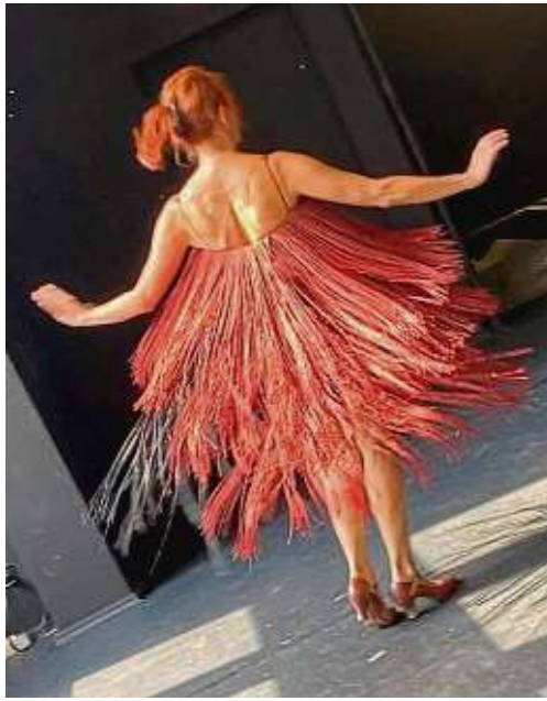
Das Musiktheater ohne Sprache „sWingin´ Theaterhaus Ensemble“ wird im Theaterhaus gezeigt.

Hop und Stepptanz neu mitzuteilen und das musikalische Material der Swing-Era verleiht ihnen den passenden Soundtrack dazu. Weitere Termine sind am Sonntag, 21. April, ab elf Uhr, am Montag, 22. April, ab zehn Uhr, am Dienstag, 23. April, ab zehn Uhr, am Mittwoch, 24. April, ab zehn Uhr. Die „Overhead Geschichte“ gibt es am Samstag, 27. April, ab elf Uhr mit anschließender Familienkonferenz. Und darum geht's: Ist das etwa von Mozart? Von welchem Mozart eigentlich?