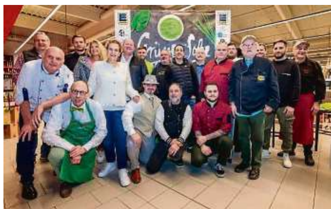
Das Team ums Grüne Soße Festival freut sich schon...