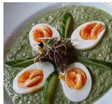
... auf „Grie Soße“ in diversen Varianten