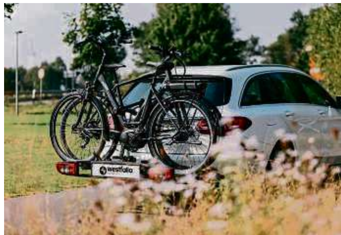
Wer mit dem Fahrrad verreisen möchte, ist mit einem Anhänger von Westfalia Eichmann gut beraten.