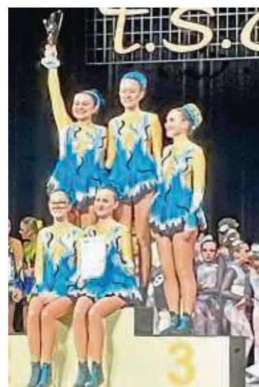
Die Gruppe in Siegerpose auf dem erstrebten Treppchen.