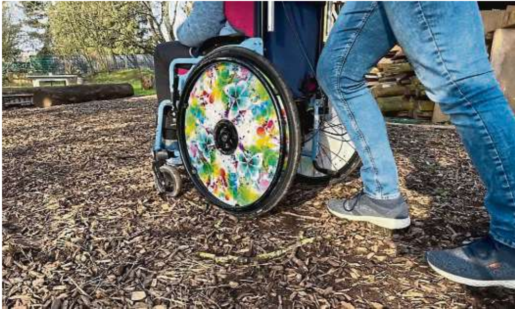
Für Kinder mit Rollstuhl ist der Zugang zum Abenteuerspielplatz Sindlingen wegen des unbefestigten Bodens noch kaum möglich.

„Für den gesellschaftlichen Zusammenhalt ist es wichtig, dass alle jungen Menschen zusammenkommen und spielen können. Unsere Aufgabe besteht darin, die Voraussetzungen dafür zu schaffen“, sagt Eskandari-Grünberg. „Dabei ist Barriere-