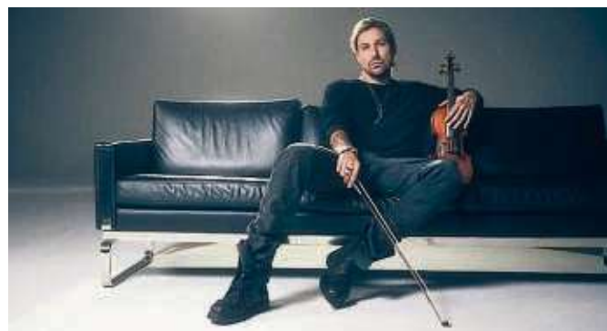
Geiger David Garrett kommt mit Gitarrist und Bassist an zwei Tagen im Mai in die Alte Oper Frankfurt.