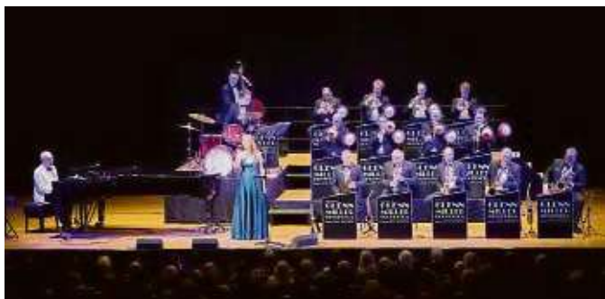
Das Glenn Miller Orchestra tritt mit einer Sängerin auf.

Zudem verlost das Wochenblatt dreimal zwei Karten für das Konzert in der Alten Oper. Wer bis Mittwoch, 10. Januar, zehn Uhr, eine Mail mit dem Betreff „Glenn Miller“ an gewinn@frankfurter-wochenblatt.de sendet, landet im Lostopf. Die Gewinner werden benachrichtigt. Der Verlag beachtet bei Verwendung der Daten die schutzrechtlichen Bestimmungen. Sie werden nur fürs Gewinnspiel verarbeitet, nicht weitergegeben.