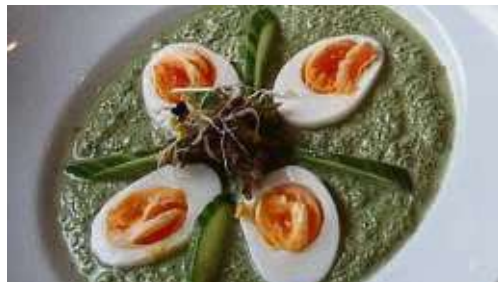
Grüne Soße gibt's wieder in vielen Varianten.

ist bereits gestartet, alle Infos und das Bewerbungsformular für Gruppenbuchungen gibt es im Internet auf gruene-sosse-festival.de .