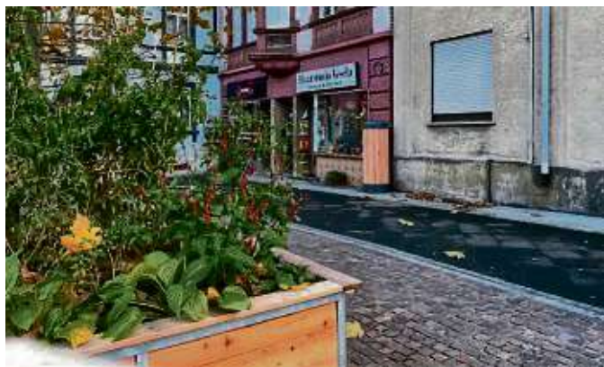
Eins der gemeinschaftlich gepflegten Pflanzbeete der Initiative Höchster Stadtgärtner.

Höchst (red) – Die Initiative „Höchster Stadtgärtner*innen“ hat Mitte November auf dem Höchster Andreasplatz Frankfurts erste Regentonne im öffentlichen Raum aufgestellt. Das gesammelte Regenwasser wird eingesetzt, um die gemeinschaftlich gepflegten Pflanzbeete der Initiative mit Wasser zu versorgen. Unterstützung erhielt die Gruppe dabei aus dem Förderprogramm „Innenstadt Höchst“ des Stadtplanungsamts und vom Grünflächenamt.