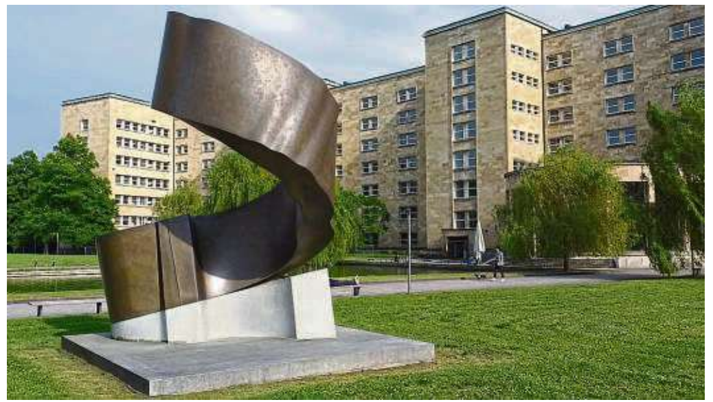
Die Goethe Uni in Frankfurt hat die Juco-Studie mit der Uni Hildesheim ausgeführt.

Zu den Folgen der Pandemie gehört ebenfalls, dass viele junge