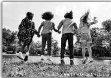
Kinder und Jugendliche haben eigene Rechte. Dies sollte auch für ihre Gesundheit gelten.

(djd-p). So steht es zumindest in der UN-Kinderrechtskonvention. Doch die Realität ist leider eine andere: Längst nicht alle Kinder haben Zugang zur bestmöglichen Gesundheitsversorgung – auch in Deutschland. Um die Arzneimittelversorgung unserer rund 14 Millionen Kinder und Jugendlichen zum Beispiel ist es nicht gut bestellt: Häufig gibt es keine eigens für sie zugelassene Therapie. Viel zu oft müssen Kinderärzte auf Erwachsenenmedizin zurückgreifen. Das birgt Risiken, denn die Präparate sind nicht auf den kindlichen Stoffwechsel angepasst, Nebenwirkungen können gravierender ausfallen. Zudem fehlt es an klinischen Studien für diese Altersgruppe. Sie sind Voraussetzung dafür, dass Kindermedikamente zugelassen werden. „Neue Wirkstoffe müssen genauestens