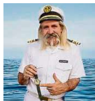
Der Gesundheitskapitän kommt nach Frankfurt. Foto: Veranstalter/p

Und das tut er: Zur Veranschaulichung und aktiven Nutzung erhält jeder Gast eine Gesundheitsschatzkiste mit Erkenntnis-