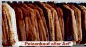
Pelzankauf aller Art*