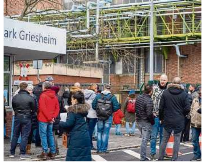
Das Adventsfenster lud etwa in den Frankfurter Ruder-Club Griesheim 1906 und in den ehemaligen Industriepark.

Ob Umtrunk, Kaffee und Kuchen, ein kleiner Weihnachtsmarkt, Führungen oder ein geschmücktes Fenster: Die Gastgeber der Griesheimer Adventsfenster gestalteten ihre Events mit viel Engagement. Ihnen ist es zu verdanken, dass in diesem Jahr eine Spenden-