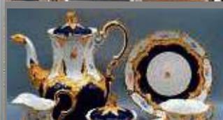
Tafelsilber aller Art