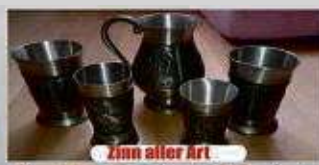
Zinn aller Art