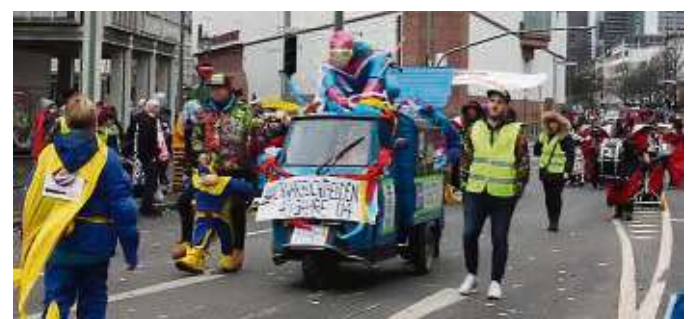
Kurz bevor die Corona-Pandemie auch in Hessen ankam, zog der Frankfurter Fastnachtsumzug noch durch die Innenstadt.

Der Preis ist mit 5000 Euro dotiert. Das Geld wird an die Preisträger vergeben und auf die ersten drei Plätze aufgeteilt. Der Frankfurter Pflegepreis wird alle zwei Jahre vergeben. Bewerbungen können bis 15. März eingereicht werden. Infos online auf frankfurt.de/pflegepreis .