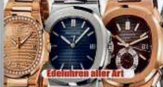
Edeluhren aller Art

Ihre Vorteile: ✓ kostenlose Beratung ✓ kostenlose Wertschätzung ✓ transparente Abwicklung ✓ Bargeld sofort