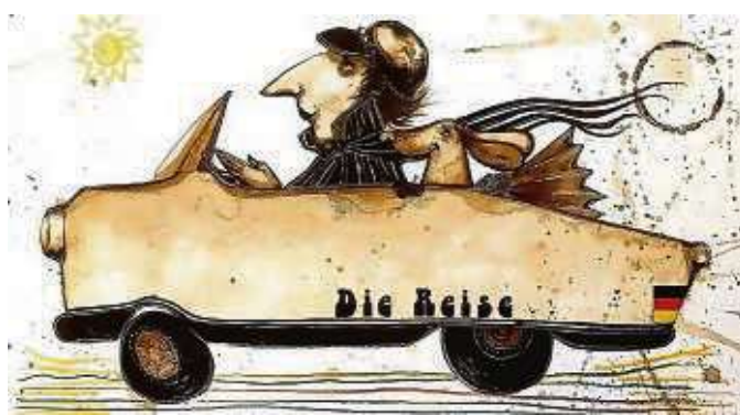
Die Zeichnung „Der Böse Friederich in Frieden“ von Max Pedreira.

Glas oder in Vitrinen, aber als wir sie auspackten, rochen sie sehr stark nach dem koffeinhaltigen Getränk.“ Pedreira trug den Kaffee mal ganz dünn und durchscheinend, dann wieder pastös auf. Er setzte dazu farbige und goldene Akzente.