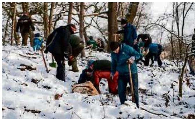
Die Teilnehmenden bei der Pflanzaktion im Jahr 2023.

Aus organisatorischen Gründen ist die Teilnahme an der Pflanz-