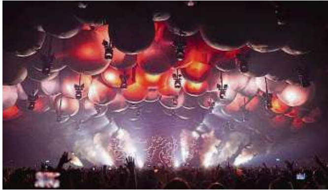
Die Time Warp verbindet visuelle Effekte mit dem Nonplusultra der elektronischen Musik – und das seit 30 Jahren.