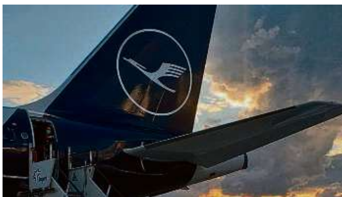
Der Flughafen Frankfurt ist der größte deutsche Verkehrsflughafen.