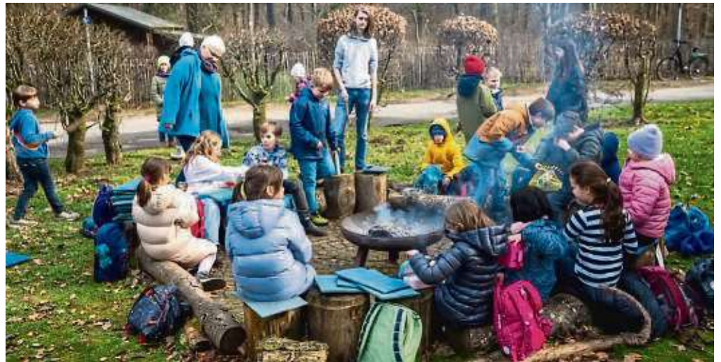
Die Klasse 3a der Textorschule stellt Holzkohle in der Lernwerkstatt Wald und Energie her.