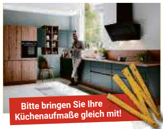
Bitte bringen Sie Ihre Küchenaufmaße gleich mit!