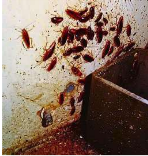
Die Lebensmittelkontrolle des Ordnungsamts musste im Januar 21 Lebensmittelbetriebe in Frankfurt schließen, unter anderem wegen Schabenbefall und starker Verschmutzungen.

In einem Supermarkt wurde verdorbenes Fleisch vorgefunden. In einem Restaurant im Frankfurter Bahnhofsviertel entdeckte der Lebensmittelkontrolleur ein Schabennest hinter einer Arbeitsfläche auf einem völlig verdreckten Fußboden, die Kochstellen waren stark verunreinigt, Fleischlieferungen nicht durchgängig gekühlt worden und das Handwaschbecken für die Mitarbeitenden dreckig sowie die Sei-