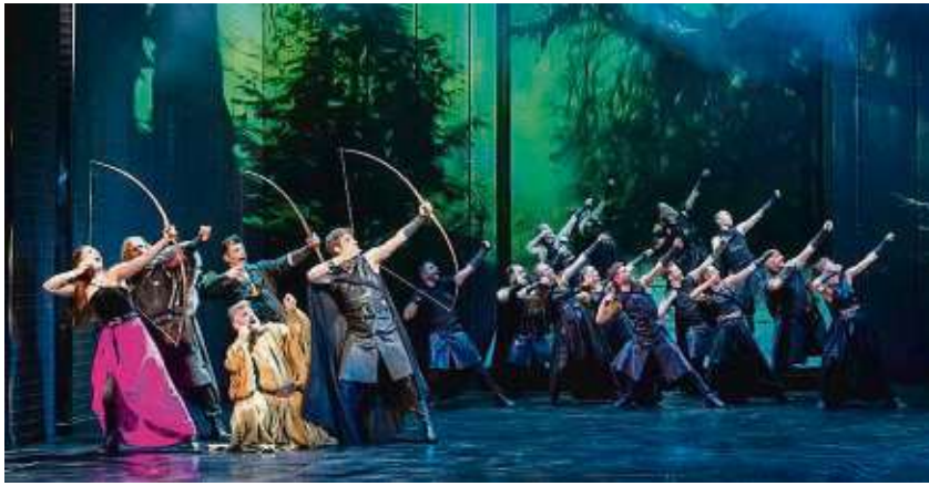
Das Robin-Hood-Musical wird über Ostern an mehreren Tagen in der Alten Oper Frankfurt aufgeführt.