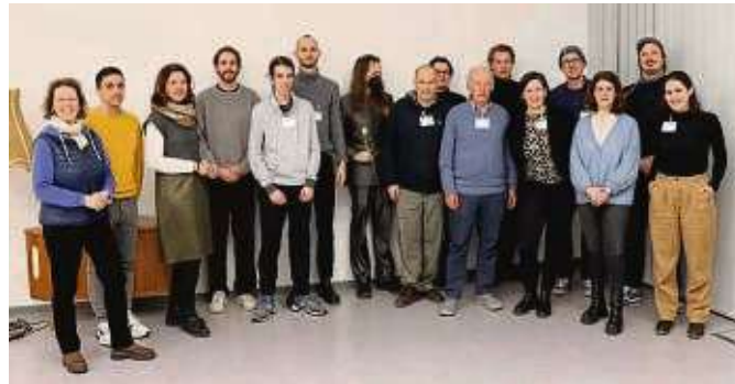
Die Mitglieder des Arbeitskreises bei der Abschlusssitzung zur Erarbeitung der Richtlinie Öffentlichkeitsbeteiligung.