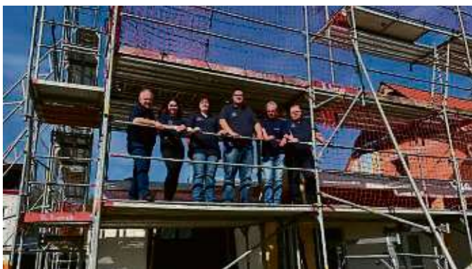
Guter Dinge, auch wenn das Dach noch fehlt: Vorstand der DLRG Ortsgruppe Nieder-Eschbach auf der Baustelle.

Nieder-Eschbach (jdi) – Es ist die Vollendung dessen, was die DLRG-Ortsgruppe Nieder-Eschbach gern vor mehr als zehn Jahren getan hätte: Der Bau der zweiten Dachhälfte ihrer Ausbildungs- und Rettungsstation an der Heinrich-Becker-Straße. Es waren die fehlenden finanziellen Möglichkeiten, die 2010 lediglich die Realisierung des rechten Dachausbaus zuließen.