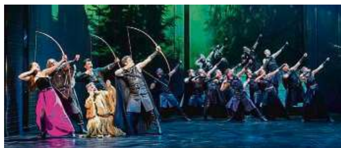
„Robin Hood – Das Musical“ wird mehrere Tage lang über Ostern an der Alten Oper in Frankfurt aufgeführt.

lung des Titelhelden. Alle Termine sowie Tickets zu ab 29 Euro plus Gebühren gibt es online auf tickets-direkt.de , an den bekannten Vorverkaufsstellen sowie unter ☎ 01806 101011.