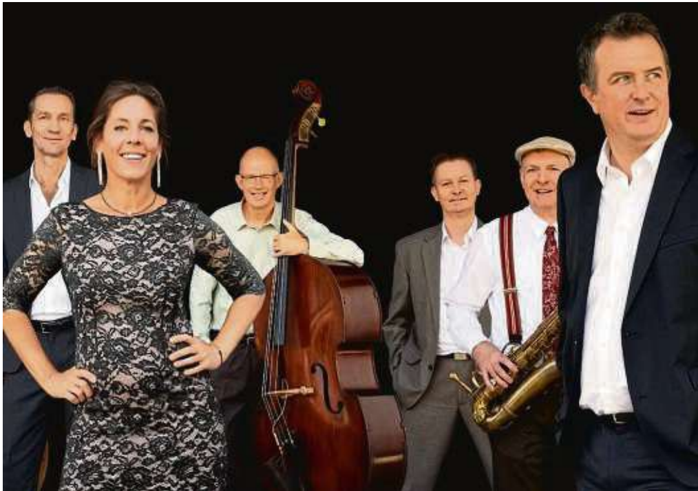
Im „Ella & Louis Jazz Club“ findet der Abend „Because of Swing“ statt.

Vorhören mit dem Fabrik Quartet unter dem Motto: „In-flected Memories“ ist für Donnerstag, 14. März, ab 19.30 Uhr