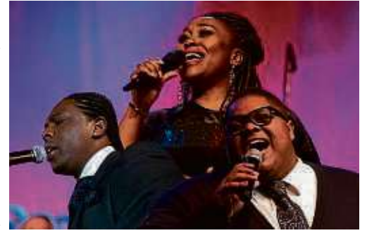
Ein Gospelkonzert mit internationalen Solisten wird die Frankfurter begeistern.