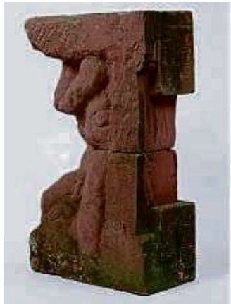
Eine der Skulpturen aus der Ausstellung „Spuren der Steine“.

derausstellung „Spuren der Steine – Skulpturen von Friedhelm Welge“ ab sofort und noch bis zum 26. Mai in der Kaiserpfalz Franconofurd, Bendergasse 3. Geöffnet ist die Ausstellung von Mittwoch bis Sonntag, je von 13 bis 17.30 Uhr. Der Eintritt ist frei.