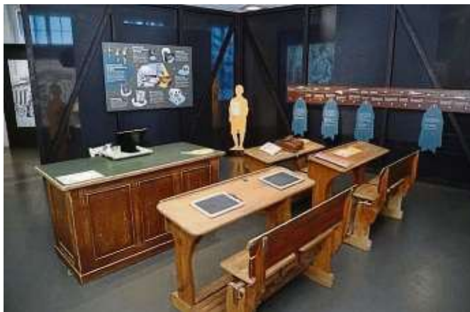
„Nachgefragt – Frankfurt und der NS“ ist noch kurze Zeit im Jungen Museum zu sehen.

Altstadt (red) – Nur noch kurze Zeit zu sehen ist die Sonderausstellung „Nachgefragt – Frankfurt und der NS“ im Jungen Museum, Historisches Museum Frankfurt, Saalhof 1. „Nachgefragt – Frankfurt und der NS“ arbeitet das Alltags- und Familienleben junger Menschen im nationalsozialistischen System auf und bildet eine Vielfalt an Perspektiven und Erfahrungen ab. Die Besucher werden in der Ausstellung durch einen „Außenraum“ und mehrere „Innenräume“ geführt, die sich mit den fünf Bereichen Schule, Familie, Spiel, Jugend und Erfahrungen im Zweiten Weltkrieg beschäftigen. Dort entdecken sie eine große Auswahl an interaktiven Materialien, etwa Zeitzeugen-Interviews, biografische Dokumente und Objekte. Kinder wie Erwachsene erfahren, welche Auswirkungen die Zeit des Nationalsozialismus auf uns heute hat, und werden dazu ermutigt, sich mit den eigenen Standpunkten auseinanderzusetzen.