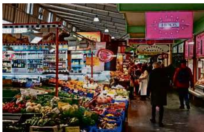
Die Kleinmarkthalle muss saniert werden.

Immer mehr Rentner sind verpflichtet , eine Steuererklärung abzugeben. Die ist nötig, wenn das zu versteuernde Einkommen den jährlichen Grundfreibetrag überschreitet. Hilfe bietet die kostenfreie Broschüre „Versicherte und Rentner – Infos zum Steuerrecht“ – online auf deutsch.e-rentenversicherung-hessen.de .