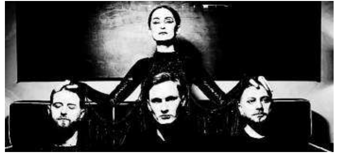
Goa treten in der Batschkapp auf.

gung, die in ihren Sets voll ausgeschöpft wird und es der Band ermöglicht, sich immer wieder neu zu erfinden – sowie die Grenzen von Genres bewusst zu überschreiten. Tickets zu ab 39,95 Euro gibt es an den bekannten Vorverkaufsstellen, unter der Tickethotline ☎ 069 902839 86 und online auf shooter.de.