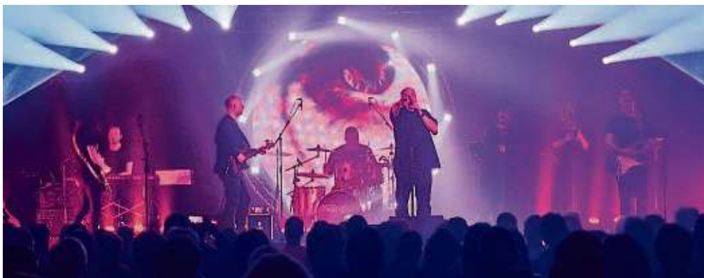
„One of these Pink Floyd Tributes“, hier auf ihrer „Dark-Side-Tour 2023“, treten im Bett auf.

Auf ihrer Version der Division Bell Tour werden sie eine stimmige Mischung von alten Klassikern und „neueren“ Songs von