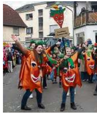
Die „Eschbäjer Zuckerreube“ waren in „Klaa Paris“ mit am Start.