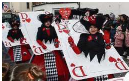
Die Karten werden neu gemischt: Eine der 111 Zugnummern.