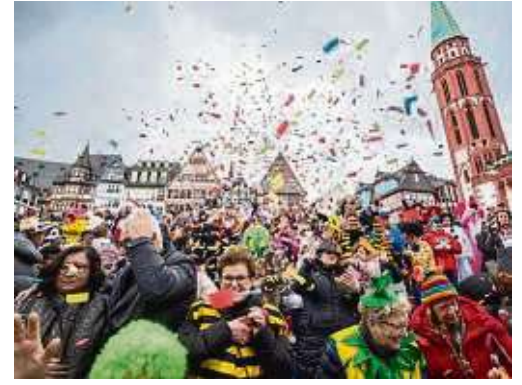
Bunt ging es zu beim Fastnachtsumzug am vergangenen Sonntag in der Innenstadt.

Rathaus-Erstürmung und Umzüge bilden die Höhepunkte der Fastnachtszeit