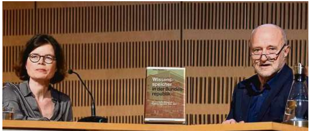
Helke Rausch im Gespräch mit Wolfgang Niess.

Der Start der künftigen Bibliothek erfolgte unmittelbar nach Ende des Zweiten Weltkriegs auf Initiative der amerikanischen Besatzungsmacht. Der erste Raum befand sich im Rothschildpalais am Untermainkai. „Die Gründung wur-