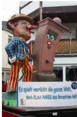
„Es spielt verrückt die ganze Welt, doch Klaa Paris das Brauchtum hält.“