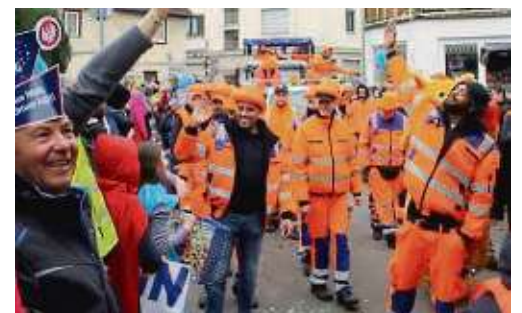
Die FES-Mitarbeiter bereiteten den Anwesenden besonders viel Freude mit ihrer herzlichen Art.

der 185. Fastnachtsumzug statt. Unter dem Motto „Es spielt verrückt