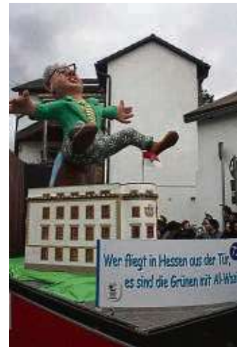
Tarek Al-Wazir bekommt – wie die Ampel und andere – sein Fett weg.