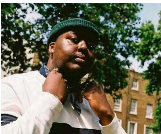
Singer-Songwriter Jordan Mackampa kommt nach Hausen.

Eschersheim gegründet. Dieser findet jeden dritten Mittwoch im Monat ab 18 Uhr im Restaurant „Platz 1“ im Tenniszentrum Klüh im Uhr 23 statt.