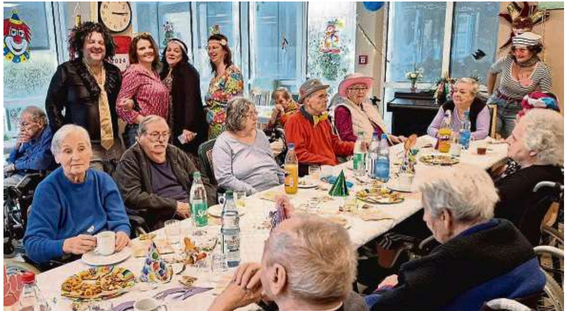
Gemeinsam wird Faschnacht gefeiert im Haus an den Niddaaunen in Eschersheim.

hung ab Januar zeigt auch die Wertschätzung der Unternehmensleitung an den Mitarbeitern“, ergänzt Saim zum guten Betriebsklima im Haus an den Niddaaunen. Nachdem Alleinunterhalter Frank Hammer am Dienstag mit flotten Faschingshits noch eine Weile für gute Stimmung gesorgt hat, endete der Nachmittag mit einem gemütlichen Abendessen. Und zum Frühlingsfest ist es nun nicht mehr lang hin.