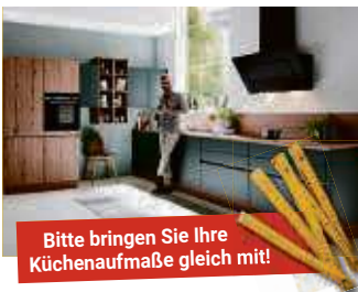
Bitte bringen Sie Ihre Küchenaufmaße gleich mit!