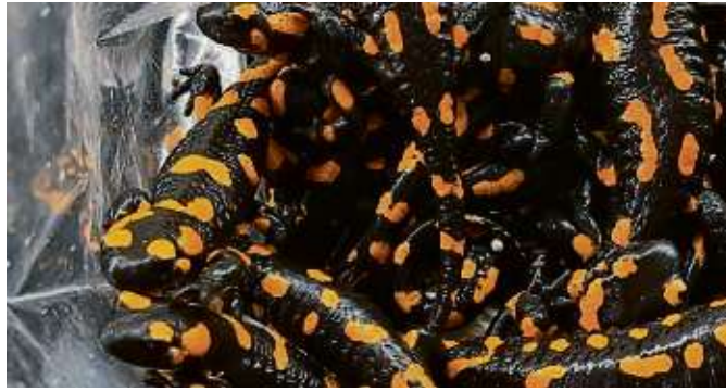
Die geretteten Salamander.

Uhr Teilspernung Fahrbahn; Schwarzwaldstraße , Niederrad, Sachsenhausen, 18. bis 22. März Vollsperrung Schwarzwaldstraße zwischen DFB und Kennedyallee Richtung Nord; Schweizer Straße 82, 84, 86 , Sachsenhausen, 18. März bis 10. Mai Teilspernung Fahrbahn/Gehweg; Stresemannallee 39 , Sachsenhausen, 18. März bis 15. April Teilspernung Fahrbahn, Radweg/Gehwege; Theatertunnel , Altstadt, 18. bis 23. März Vollsperrung der Fahrbahnen, 21 bis sechs Uhr; Triftstraße 7, 14 , Niederrad, 18. März bis 5. April Teilspernung Fahrbahn/Gehwege; Zum Apothekerhof 2 , Sachsenhausen, 18. bis 22. März Teilspernung Fahrbahn, Vollsperrung Gehwege; Atzelbergstraße 61, 63 , Seckbach, 19. bis 22. März Teilspernung Fahrbahn, Gehweg, Vollsperrung rechter Parkstreifen; Wilhelm-Leuschner-Straße 80 , Gutleutviertel, 22. März Teilspernung Fahrbahn, Vollsperrung Gehwege.