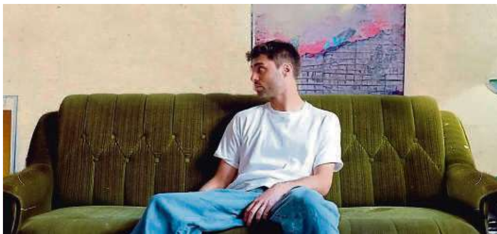
Xavi kommt mit seiner „Türsteher Tour“ nach Hausen.

Nun kommt Xavi am Freitag, 22. März, ab 20 Uhr mit seiner „Türsteher Tour“ auch nach Frankfurt in die Brotfabrik, Bachmannstraße 2-4. Es entstehen Songskizzen, die ungefiltert ihren Weg in die Socials finden. Kunst ohne Kalkül, die ankommt. Denn die kurzen Clips kommen an und sorgen innerhalb kürzester Zeit für ein enormes Following und jede Menge Liebe. Mit im Gepäck hat er sein Debüt-Album, aber auch seine millionenfach gestreamten Songs wie „Analoge Liebe“ oder „Brot und Wasser“ werden auf der Setlist nicht fehlen. Tickets zu rund 25 Euro plus Gebühren gibt es online auf brotfabrik.info .