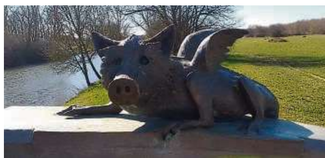
Das Grün-Gürtel-Tier bewacht den Alten Flugplatz Bonames.

Insgesamt hat Vonovia in Frankfurt einen Bestand von rund 16.100 Wohnungen. und beteiligt sich daran, Antworten auf die aktuellen Herausforderungen auf dem Wohnungsmarkt zu finden. Das Unternehmen setzt sich ein für mehr Klimaschutz, altersgerechte Wohnungen und ein gutes Zusammenleben in den Quartieren. In Kooperation mit sozialen Trägern und den Bezirken unterstützt Vonovia soziale und kulturelle Projekte, die das nachbarliche Gemeinschaftsleben bereichern. Zudem beteiligt sich Vonovia an der im Moment besonders wichtigen gesellschaftlichen Aufgabe: Dem Bau neuer Wohnungen.