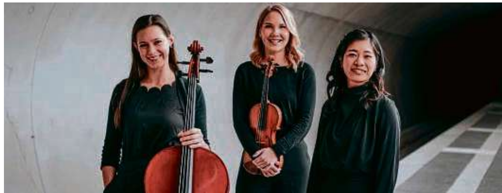
Das Trio Hannari ist im Februar zu Gast bei der Frankfurter Bürgerstiftung.

dem Eliot Quartett – aus „Les Vendredis“ für Streichquartett; I. Strawinsky: Drei Stücke für Streichquartett; D. Schostakowitsch: Streichquartett Nr. 2 A-Dur, op. 68. Der Eintritt beträgt zwischen 14 und 39 Euro. Zum Frankfurter Bürgersalon: „Kirche, Gesellschaft, Staat – und die Frage des Zusammenhalts“ lädt die Frankfurter Bürgerstiftung für Mittwoch, 28. Februar, ab 19.30 Uhr ein: Einem Vortrag von Volker Jung, Präsident der Evangelischen Kirche in Hessen und Nassau. Eintritt ist frei, die Anmeldung erforderlich (frankfurter-buergerstiftung.de). Um „Salon kontrovers: Briefe – schreiben und lesen“ geht es am Donnerstag, 29. Februar, ab 19.30 Uhr. „Lieber Papa, es hat mich schon lange niemand ‚Schwarzer Teufel‘ genannt, und das fehlt mir sehr.“: Der Briefwechsel zwischen Sigmund Freud und Anna Freud wird gelesen von Jochen Nix und Birgitta Assheuer. Die Konzeption und Einführung übernimmt Ruthard Stäblein. Der Eintrittspreis liegt bei fünf, zehn oder 14 Euro. Der Veranstaltungsort ist immer – sofern nicht anders angegeben – die Frankfurter Bürgerstiftung im Holzhausenschlösschen, Justinianstraße 5. Alle Veranstaltungen der Frankfurter Bürgerstiftung werden mit Spenden finanziert. Wer sich beteiligen möchte, kann das über das folgende Spendenkonto tun: Frankfurter Sparkasse (BIC: HELADEF1822), Iban: DE76 5005 0201 0000 2662 99. Ausführliche und weitere Informationen gibt es im Internet auf der Homepage frankfurter-buergerstiftung.de.