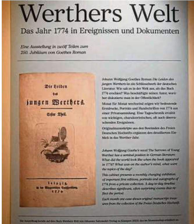
Plakat im Handschriftenstudio, ausgestellt im Romantikmuseum.

„Die Wirkung dieses Büchleins war groß, ja ungeheuer, und vorzüglich deshalb, weil es genau in die rechte Zeit traf. Denn wie es nur eines geringen Zündkrauts bedarf, um eine gewaltige Mine zu entschläudern, so war auch die Explosion, welche sich hierauf im Publikum ereignete, deshalb so mächtig, weil die junge Welt sich schon selbst untergra-