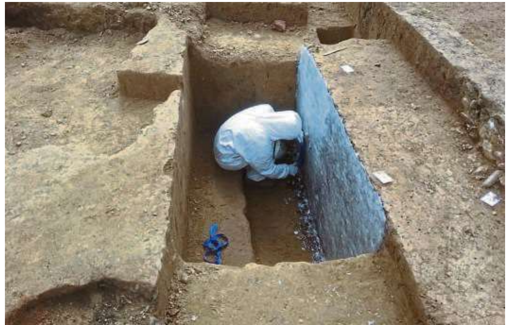
Die Herstellung des Lackprofils auf der archäologischen Ausgrabung im April 2017.

Weitere interessante Themen und Funde rund um Ausgrabungen gibt es im Archäologischen Museum (AMF), Karmelitergasse 1. Geöffnet ist mittwochs von zehn bis 20 Uhr und donnerstags bis sonntags, je von zehn bis 18 Uhr. Das Archäologische Museum bewahrt, erforscht und vermittelt die älteste Geschichte Frankfurts und macht die klassische Antike und den Alten Orient