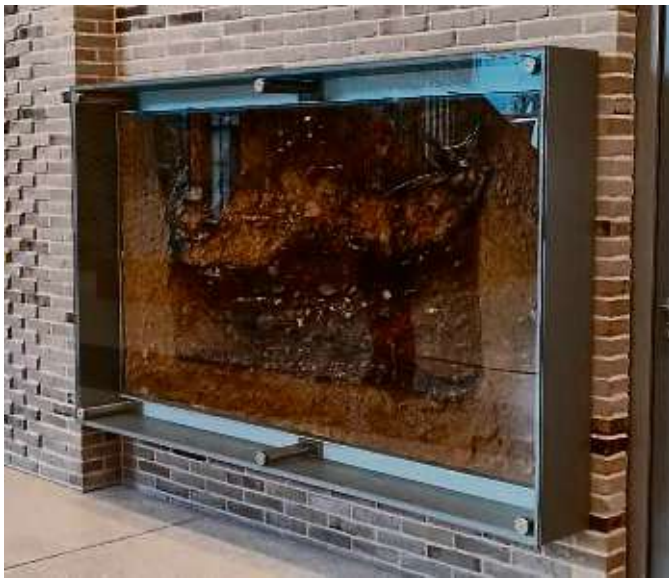
Das Lackprofil kehrt zurück an seinen Entstehungsort in Heddernheim: Die Präsentation in der Römerstadtschule.

Heddernheim (red) – Vor Kurzem konnte das Lackprofil einer römischen Kultgrube aus Nida an seinen Fundort, den Standort der Römerstadtschule in Frankfurt-Heddernheim, zurückkehren. Dort wird es nun im Schulgebäude präsentiert.