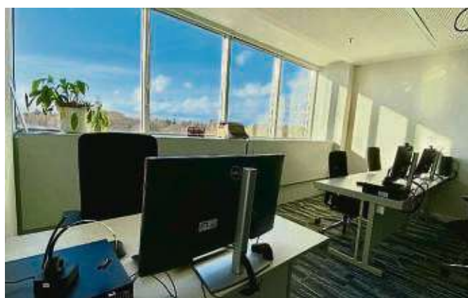
Im Schulungsraum des Frauen-Softwarehauses lernen Interessierte, mit der Computer-Technik umzugehen.

2024 wird die erfolgreiche, FRAP geförderte Reihe fortgesetzt und schon jetzt werden die Plätze vergeben. Interessierte sollten sich so rasch wie möglich beim Frauen-Softwarehaus melden. Sobald die Hessischen Winterferien beendet sind, startet der nächste Basiskurs, der an drei Tagen der Woche von 13.30 bis 16.45 Uhr stattfinden wird. Die Teilnahme ist für zugangsberechtigte Frauen kostenfrei und die Fahrtkosten werden erstattet. Den Kontakt und weitere Infos finden Interessierte online auf https://www.new-hessen.de/frauen-softwarehaus-e-v .