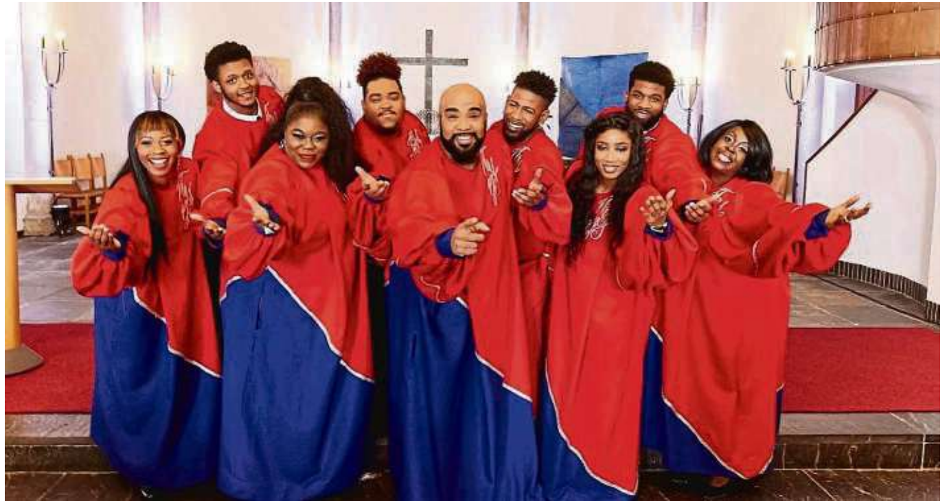
Gospel live erleben: Die New York Gospel Stars treten in der Frankfurter Altstadt auf.

Frankfurter Berg (red) – Bei Kranarbeiten zum S6-Ausbau wird der Verkehr in der Homburger Landstraße zwischen Im Hilgenfeld und Omegabrücke bis Freitag, 16. Februar, mit einer Ampel geregelt. Radfahrer sowie Fußgänger werden entlang der Baustelle geführt.