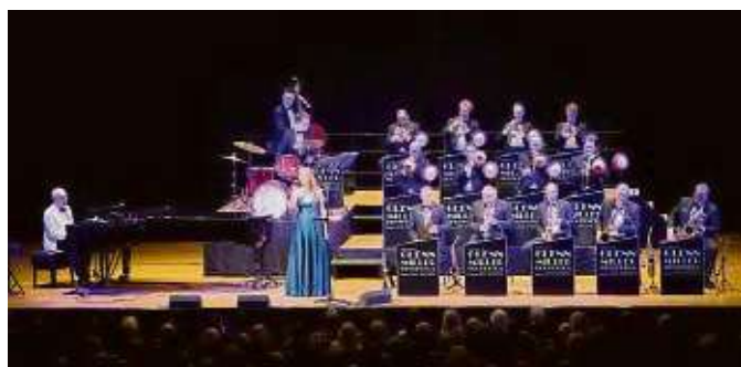
Das Glenn Miller Orchestra tritt mit einer Sängerin auf.

Zudem verlost das Wochenblatt dreimal zwei Karten für das Konzert in der Alten Oper. Wer bis Mittwoch, 10. Januar, zehn Uhr, eine Mail mit dem Betreff „Glenn Miller“ an gewinn@frankfurter-wochenblatt.de sendet, landet im Lostopf. Die Gewinner werden benachrichtigt. Der Verlag beachtet bei Verwendung der Daten die schutzrechtlichen Bestimmungen. Sie werden nur fürs Gewinnspiel verarbeitet, nicht weitergegeben.