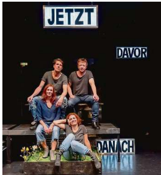
Das Stück „Runter auf Null“ zeigt Episoden über das Heranwachsen von Jugendlichen.