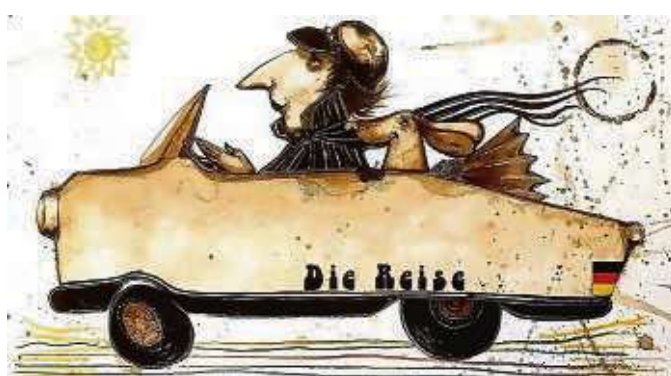
Die Zeichnung „Der Böse Friederich in Frieden“ von Max Pedreira.

Glas oder in Vitrinen, aber als wir sie auspackten, rochen sie sehr stark nach dem koffeinhaltigen Getränk.“ Pedreira trug den Kaffee mal ganz dünn und durchscheinend, dann wieder pastös auf. Er setzte dazu farbige und goldene Akzente.