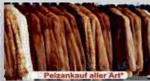
Pelzankauf aller Art*