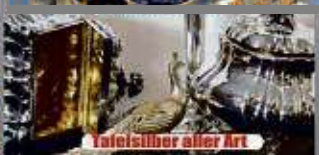
Tafelsilber aller Art

Kostenlose Begutachtung und Bewertung Ihres Schmuckstücks