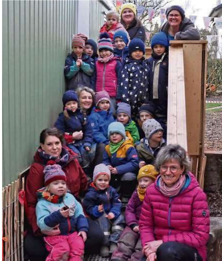
Die Wiesenwichtel freuen sich, dass sie jetzt einen tollen, neuen Bauwagen auf dem Grundstück haben.