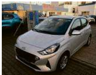
Hyundai i 10. Bj. 22, 25.000 KM, viele Extras, 12.450 €. Autohaus Müller, Industriestr. 7, 63150 Heusenstamm, ☎ 06104-8024444