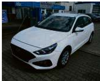
Hyundai i 30 Kombi. Bj. 21, viele Extras, 50.000 KM, 14.750 €. Autohaus Müller, Industriestr. 7, 63150 Heusenstamm, ☎ 06104-8024444