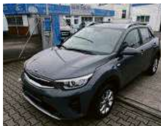
Kia Stonic.1.2i Bj. 21, Extras, 39.000 KM, 15.950 €. Autohaus Müller, Industriestr. 7, 63150 Heusenstamm, ☎ 06104-8024444