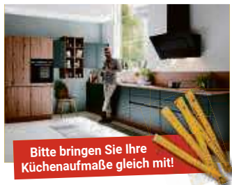
Bitte bringen Sie Ihre Küchenaufmaße gleich mit!