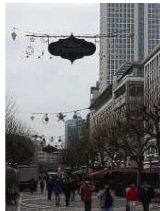
Auf der Freßgass' wird „Happy Ramadan“ gewünscht.

weiter. Als Sozialdemokraten wissen wir seit Jahrzehnten, was es heißt, gemeinsam einzustehen – ob gleicher Lohn oder jetzt gleiche Aufmerksamkeit. Und wir kennen die ewiggestrigen Re-