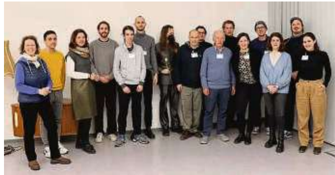
Die Mitglieder des Arbeitskreises bei der Abschlussitzung zur Erarbeitung der Richtlinie Öffentlichkeitsbeteiligung.