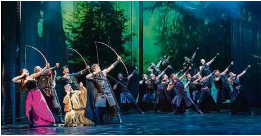
Das Robin-Hood-Musical wird über Ostern an mehreren Tagen in der Alten Oper Frankfurt aufgeführt.