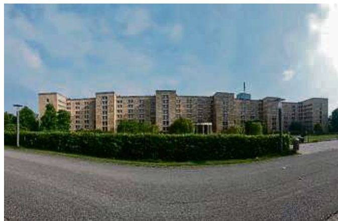
Die Initiation des bundesdeutschen Grundgesetzes fand die im I.G. Farben-Bau statt, dem heutigen Uni-Campus Westend.

Frankfurt (red) – Früher waren Ärzte in Deutschland vor allem weiße Männer, die in die Fußstapfen ihrer Väter traten. Das System reproduzierte sich selbst und damit den Erfolg von Repräsentanten einer bestimmten sozialen Schicht. Die Zugehörigkeit zu einer sozialen Klasse, aber auch zu einer Berufsgruppe oder Religion ging meist auch einher mit bestimmten politischen Überzeugungen. Auch wenn diese Beschreibung schon für damals etwas vergröbernd ist: Man braucht keinen besonderen Scharfblick, um zu erkennen, dass sich gesellschaftliche Status- und Machtverhältnisse verschoben haben. Das Bild auch der prestigeträchtigsten Berufsfelder ist heterogener denn je. Zugrunde liegt eine enorme Expansion im Bildungssystem: Seit den 1960er-Jahren besuchen immer mehr Kinder und Jugendliche aus unteren sozialen Schichten und unterschiedlichster ethnischer Herkunft höhere Schulformen. Auch die Studierendenschaft wird Jahr für Jahr heterogener. Und so stellt die neue „Unordnung“ die alte, oft beharrliche „Ordnung“ von Institutionen wie Schule und Universität, aber auch die des Arbeitsmarkts infrage. „Die Veränderungen, die wir erleben, sind alles andere als marginal. Sie sind so fundamental, dass sie die Sozialstruktur insgesamt verändern“, sagt Daniela Grunow, Professorin für Sozio-