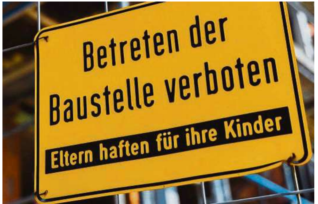
Die IG Bau fordert mehr Sozialwohnungen und weniger Mietzahlungen an Vermieter.

Die Gewerkschaft geht noch einen Schritt weiter: Die IG Bau wirft dem Staat ein „Missmanagement bei der Unterstützung fürs Wohnen“ vor. Bund und Länder hätten den sozialen Wohnungsbau seit Jahrzehnten „massiv vernachlässigt“. Das sei