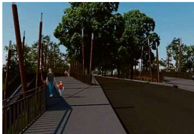
Eine Stegkonstruktion soll künftig Fußgänger und Radfahrer auf die Carl-Ulrich-Brücke leiten.

Fechenheim (red) – Die Carl-Ulrich-Brücke ist eine zentrale Mainverbindung zwischen Fechenheim Offenbach. Insbesondere für den Rad- und Fußverkehr ist die Verkehrssituation aber verbesserungsbedürftig: Die Gehwege sind schmal und in Fahrtrichtung Frankfurt muss sich der Radverkehr den engen Straßenraum mit Schwerlastverkehr teilen. In Richtung Offenbach sind die Voraussetzungen nur wenig besser, existiert dort im Bestand lediglich ein markierter, gleichfalls schmaler Schutzstreifen auf der Fahrbahn. Die Stadt Frankfurt arbeitet an einer komplexen Lösung.