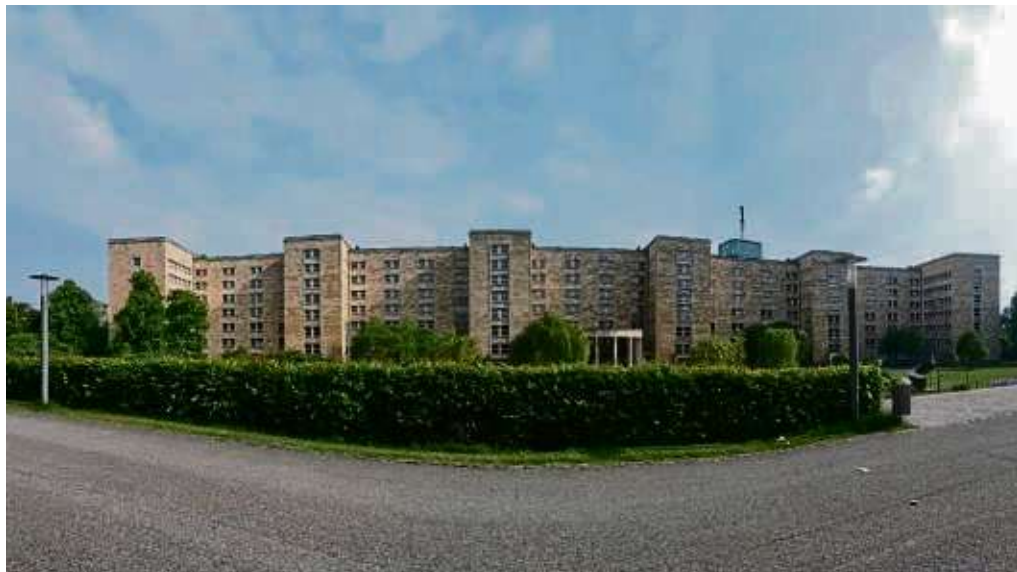
Die Initiation des bundesdeutschen Grundgesetzes fand im I.G. Farben-Bau statt, dem heutigen Uni-Campus Westend.

Für Interessierte: Die Ausgabe ist online zu finden auf der Seite forschung-frankfurt.de .