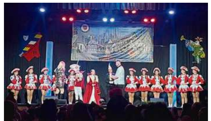
Auch bei Sitzungen haben die Narren aus Fechenheim alles gegeben.