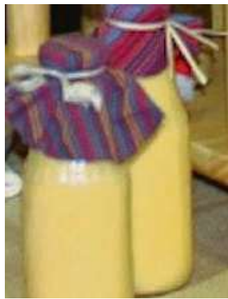
Der beliebte Eierlikör der „Soli“.

mit es keine Enttäuschung gibt, weil er ausverkauft ist. Infos erhalten und Vorbestellungen machen, ist möglich bei Erika Breitenbach unter ☎ 069 43005871 auf dem Anrufbeantworter oder per E-Mail an rmsv-fechenheim@web.de .