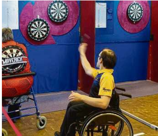
Darts ist ein sehr inklusiver Sport und kann auch mit einem Handicap ausgeübt werden.

„Das Wichtigste beim Darts ist der gegenseitige Respekt. Egal, ob man gewinnt oder verliert, am Ende klatscht man sich ab“, sagt Pabst. Die