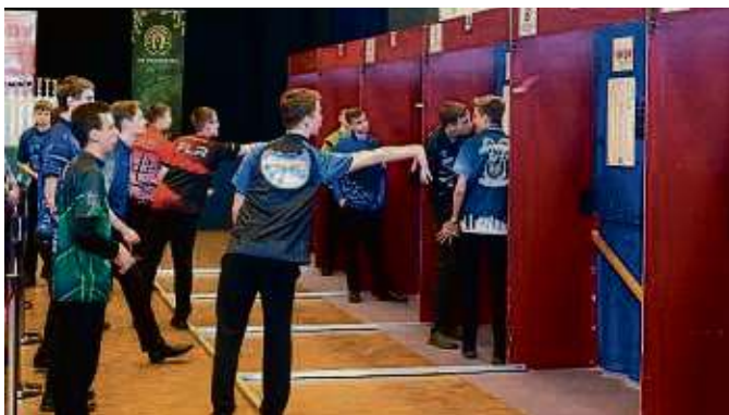
Rund 400 Teilnehmer ließen an zwei Tagen in der Stadthalle Bergen die Pfeile fliegen.

Bergen-Enkheim (rus) – Wer in Hessen leidenschaftlich gerne Darts spielt, war am Wochenende des 9. und 10. März in der Stadthalle Bergen beim siebten Ranglistenturnier des Hessischen Dartverbands (HDV) in dieser Saison dabei. Ob jung oder alt, mit oder ohne Handicap, alleine oder im Doppel – jeder konnte gegen eine geringe Startgebühr teilnehmen. Insgesamt traten rund 400 Teilnehmer an beiden Tagen an.