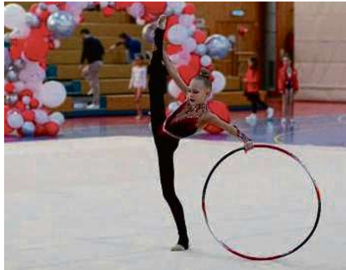
Die Teilnehmerinnen der Gaumeisterschaften in der Rhythmischen Sportgymnastik zeigten professionelles Auftreten.

nen des Turngau Frankfurt sowie zwei Teams an. Zusammen mit dem Turngau Offenbach-Hanau gingen insgesamt 117 Teilnehmerinnen und zwölf Teams unter Anfeuerungsrufen des Publikums an den Start. Die Sportlerinnen zwischen sechs und 16 Jahren brillierte in individuellen Wettkämpfen.