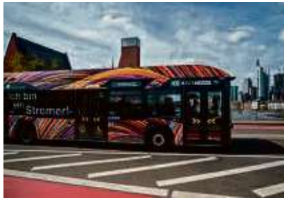
Wasserstoffbusse, wie hier auf der Buslinie M36, gehören mittlerweile zu Frankfurts Stadtbild.

64 ist dann komplett mit Brennstoffzellenfahrzeugen bestückt, insgesamt verfügt die ICB-Busflotte damit über gut 18 Prozent „Stromer“.