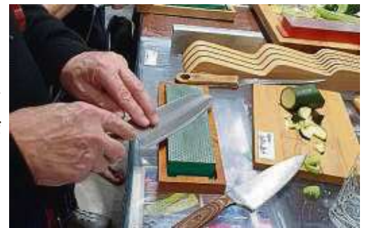
Die Teilnehmer üben das Schärfen von Messern mit dem Diamant-Schärfblock.