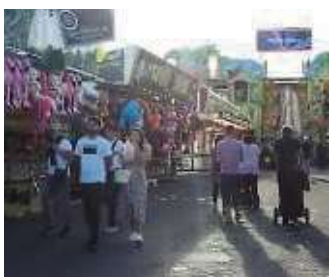
Auf der Frühjahrs-Dippemess können Jung und Alt Spaß haben.

Bornheim (red) – Die Dippemess auf dem Festplatz am Ratsweg ist am Freitag wieder gestartet. Bis zum 14. April lädt das bunte Volksfest mit Tradition wieder die ganze Familie ein, Spaß zu haben, lecker zu essen, Karussells zu fahren und Spiele zu spielen. 19 Hoch-, Fahr- und Belustigungsgeschäfte wie Alpina-Bahn, Taumler und Hip-Hop Fly sowie zwölf Kinderfahrzeuge wie Mini Airport und Cirkus Welt sind vor Ort. Infos und Öffnungszeiten gibt's online auf frankfurt-tourismus.de .