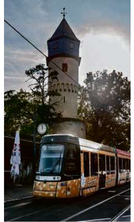
Bald ist die Haltestelle Galluswarte bereit für die neuen, 10 Meter längeren „T40“-Straßenbahnen.

Die längeren Straßenbahnmodelle werden deutlich mehr Platz bieten. Statt maximal 191 Fahrgäste, die der normale T-Wagen fassen kann, bietet der „T40“ Raum für 248 Fahrgäste, davon für 78 auf Sitzplätzen. Geplant ist, die neuen, langen Fahrzeuge zunächst auf der stark frequentierten Linie 11 zwischen Höchst und Fechenheim einzusetzen, um hier die Kapazitäten zu erhöhen.