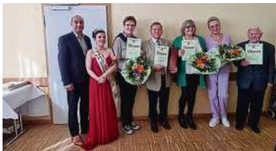
Mitgliederehrung bei der Jahreshauptversammlung des Verkehrsvereins Bergen-Enkheim.