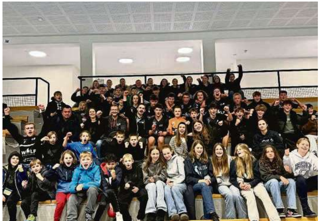
Die Teilnahme beim Lundaspelen-Turnier in Schweden werden die jugendlichen Handballer der HSG Main-Nidda noch lange in Erinnerung behalten.

Am nächsten Morgen starteten die verschiedenen HSG Main-Nidda Teams in die ersten Matches der Gruppenphase, darunter die männliche E-Jugend, die weibliche und männliche C-Jugend, die männliche B-Jugend sowie die weibliche A-Jugend. Auch der folgende Tag war geprägt von intensiven, spannenden Spielen in den verschiedenen Altersklassen. Es gab dabei