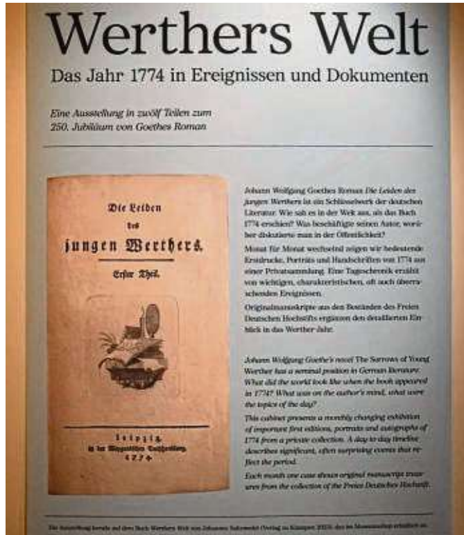
Plakat im Handschriftenstudio, ausgestellt im Romantikmuseum.

„Die Wirkung dieses Büchleins war groß, ja ungeheuer, und vorzüglich deshalb, weil es genau in die rechte Zeit traf. Denn wie es nur eines geringen Zündkrauts bedarf, um eine gewaltige Mine zu entschläudern, so war auch die Explosion, welche sich hierauf im Publikum ereignete, deshalb so mächtig, weil die junge Welt sich schon selbst untergra-