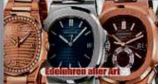
Edeluhren aller Art

Ihre Vorteile: ✓ kostenlose Beratung ✓ kostenlose Wertschätzung ✓ transparente Abwicklung ✓ Bargeld sofort