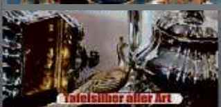
Tafelsilber aller Art

Kostenlose Begutachtung und Bewertung Ihres Schmuckstücks