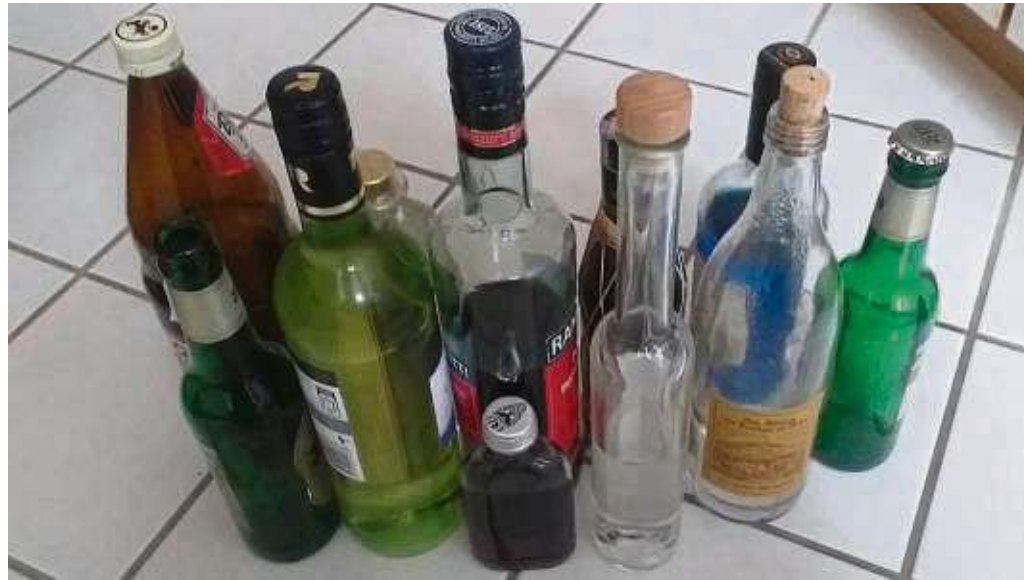
Um Komasaufen und extremem Alkoholkonsum entgegenzuwirken, ruft die DAK wieder zu der Kampagne „bunt statt blau“ auf, bei der Kinder Plakate gestalten können.