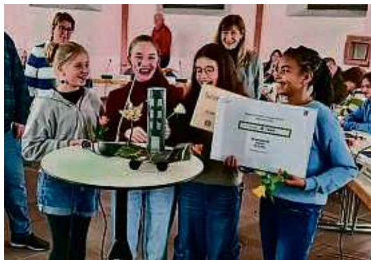
Die Schüler freuten sich über Preise für den Wettbewerb „Ökologische Projekte“ des Ortsbeirats.

Ein zweiter Preis ging an die Jugendforscht-AG der Schule am Ried mit dem Projekt „Ohne Dampf kein Mampf“, bei dem es um möglichst energiesparendes