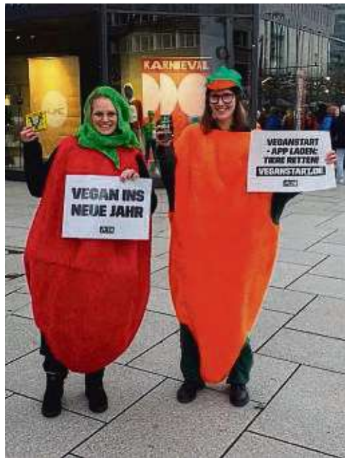
Als Gemüse verkleidet sensibilisieren Mitglieder des Peta-Streetteams für vegane Ernährung.

Innenstadt (red) – Vegan ins neue Jahr: Als Karotte und Tomate verkleidet appellieren Aktive des freiwilligen Peta-Streetteams Rhein-Main an alle Menschen, vegan ins neue Jahr zu starten. Interessierte bekamen bei der Aktion am Samstag zwischen 13 und 15 Uhr am Brockhaus-Brunnen in der Innenstadt außerdem vegane Kostproben.