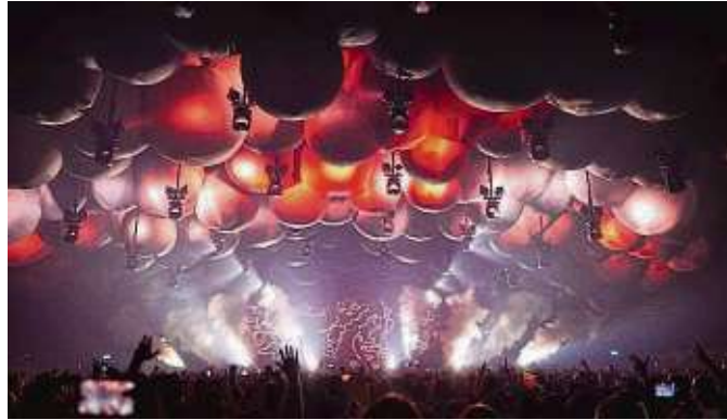
Die Time Warp verbindet visuelle Effekte mit dem Nonplusultra der elektronischen Musik – und das seit 30 Jahren.

Im Untergrund spielte Techno 1994 längst nicht mehr, elektronische Musik erlebte in Deutschland ihre erste Hochphase. Daher sollte die erste Time Warp auch kein Rave werden, wie es sie in den 90ern zu Tausenden gab, Gründer Steffen Charles wollte bereits mit der ersten Time Warp musikalisch zurück in den „Underground“. Das sollte sich im Programm widerspiegeln und im Namen: „Time Warp – zurück zur guten alten Zeit“, sagt Charles. Neben der musikalischen Ausrichtung spielte auch schon bei der ersten Party der Standort eine große Rolle: „Die