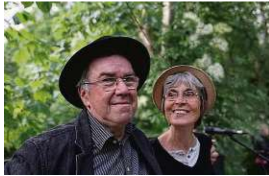
Das Akustikduo Playtime lässt in der „Mosaik-Bar“ groovige Laid-Back-Musik erklingen.

wechslungsreiche Unplugged-Versionen. Mitreißend gesungen und mit Gitarre, Flöte, Melodica und Bluesharp gespielt, verspricht der Abend groovige Laid-Back-Musik in Wohnzimmer-Atmosphäre. Weitere Infos gibt es online un-