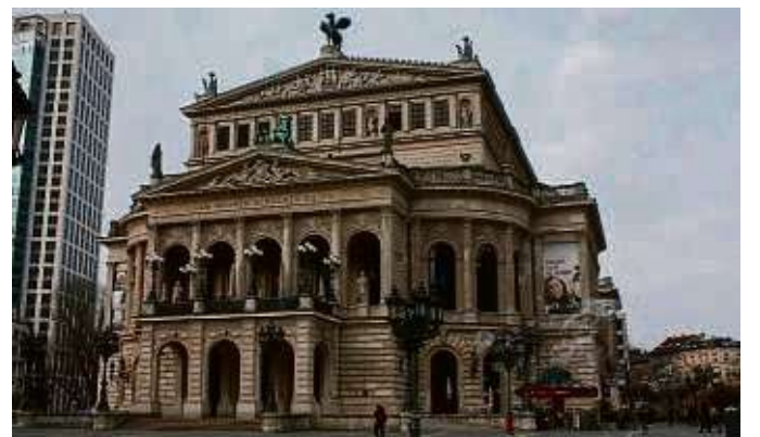
Die Alte Oper bietet in Kooperation eine Hausführung an.

Alten Oper sowie in der teilnehmenden Straße. Bürger einer Nachbarschaft werden im Projekt dabei unterstützt, Musik in ihre Wohnungen, ihre Vorgärten oder Hinterhöfe, auf ihre Plätze zu bringen. Möglich sind etwa Konzerte von Profimusikern, die über die Alte Oper vermittelt werden, eine entspannte Hinterhof- oder Straßenumusik, Hauskonzerte aus den Reihen der Nachbarschaft, eventuell auch im Einklang mit dem Musikvermittlungsprogramm „Pegasus“ der Alten Oper, Kinder-, beziehungsweise Familienkonzerte und vielleicht ein Fest zum Abschluss des Projekts. Umgekehrt lädt die Alte Oper die Teilnehmer mehrmals zu sich ein – zum Besuch ausgewählter Konzerte sowie zu einer exklusiven Führung durch das Haus. Infos gibt's online auf alteoper.de/strasse .