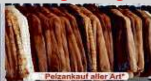
Pelzankauf aller Art*