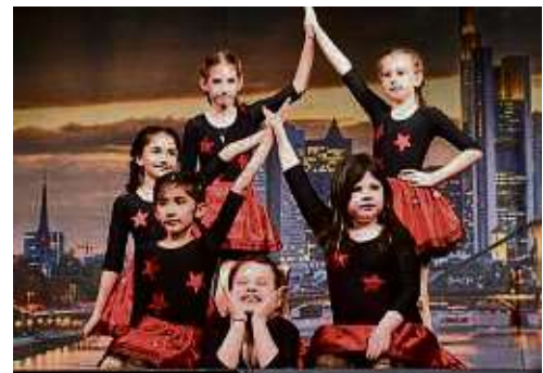
Die Mini-Zappolinis der „Hemdeklunkis“ verzauberten das Publikum.