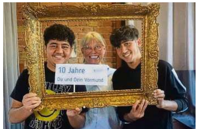
Zehn Jahre gibt es bereits die Aktion „Du und Dein Vormund“.

der persönliche Kontakt zwischen Vormund und Mündel im Vordergrund steht. Mit ihrem Einsatz ermöglichen sie Kindern und Jugendlichen so eine bestmögliche Chance auf eine positive Entwicklung und Zukunft.