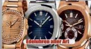
Edeluhren aller Art

Ihre Vorteile: ✓ kostenlose Beratung ✓ kostenlose Wertschätzung ✓ transparente Abwicklung ✓ Bargeld sofort