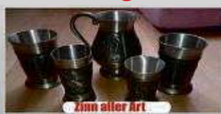
Zinn aller Art