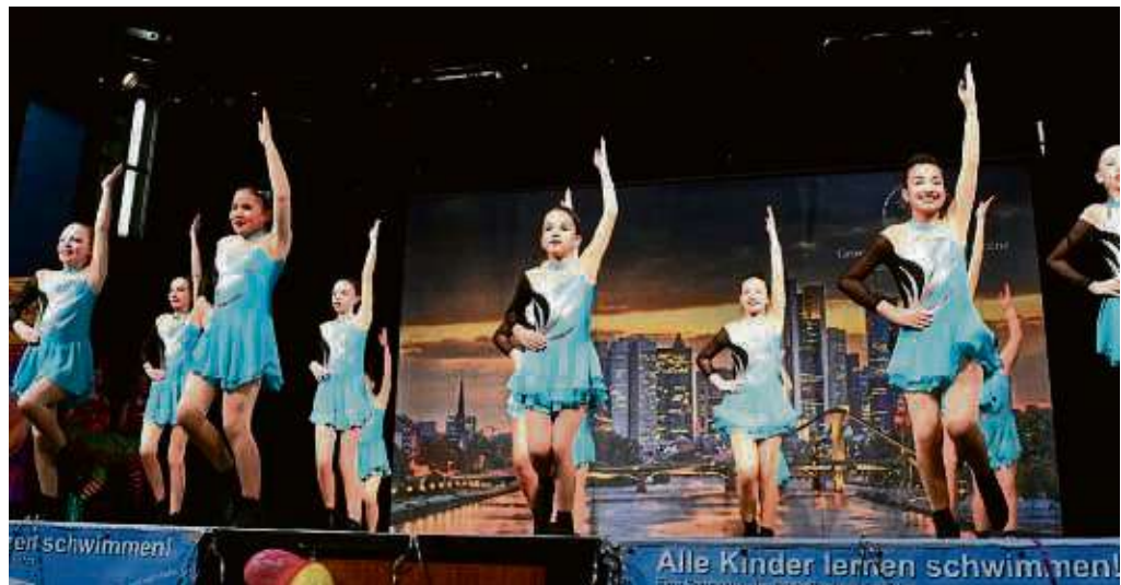
Viel Applaus gab es für die Gardetänzerinnen der „Wespen“.