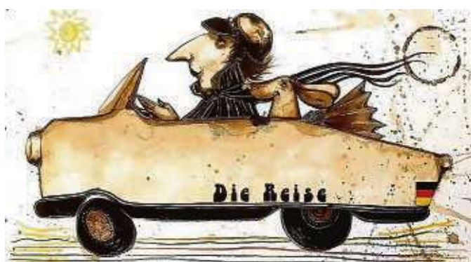
Die Zeichnung „Der Böse Friederich in Frieden“ von Max Pedreira.

Glas oder in Vitrinen, aber als wir sie auspackten, rochen sie sehr stark nach dem koffeinhaltigen Getränk.“ Pedreira trug den Kaffee mal ganz dünn und durchscheinend, dann wieder pastös auf. Er setzte dazu farbige und goldene Akzente.