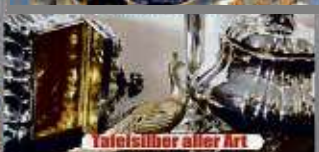
Tafelsilber aller Art

Kostenlose Begutachtung und Bewertung Ihres Schmuckstücks