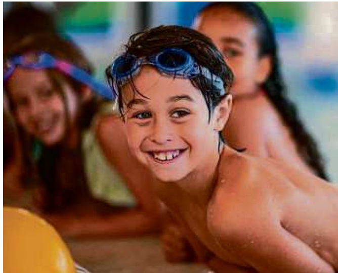
Im TaunaBad Oberursel werden im neuen Jahr wieder verschiedene Schwimmkurse angeboten.

starten außerdem die nächsten Nixen-Workshops für Kinder ab acht Jahre, in denen interessierte Mädchen und Jungen, die gerne schwimmen und tauchen, erfahren, wie es sich anfühlt, als Meerjungfrau oder Wassermann durch das Wasser zu gleiten. Jeder Nixen-Workshop dauert 45 Minuten, Voraussetzung für die Teilnahme an den Workshops ist das Ju-