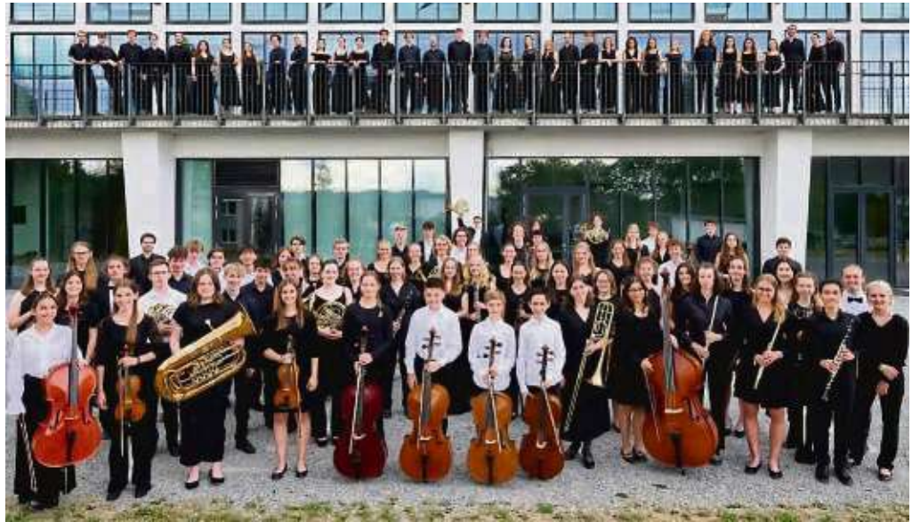
Jugendchor und Jugendorchester des Hochtaunuskreises