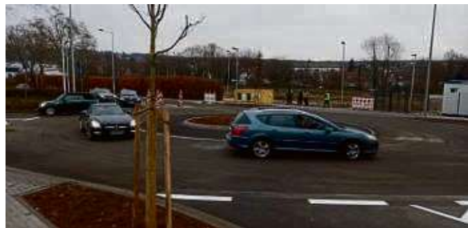
Der Kreisel ist für den Verkehr freigegeben.

von den städtischen Gärtnern Pflanzeninseln im Bereich des Kreisels angelegt und begrünt. Zusätzlich pflanzten sie neun Laubbäume: zwei Eschen, zwei Eichen, zwei Amberbäume und drei Wildapfelbäume. Im ersten Quartal 2024 werden abschließend die beiden Fahrbahnteiler angelegt. Während dieser Arbeiten muss dann die Verkehrsführung noch einmal kurzzeitig einspurig mit einer Ampel erfolgen.