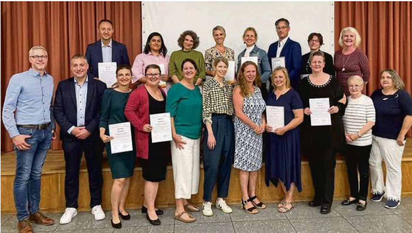
Zertifikatsübergabe an die neuen Tagespflegepersonen mit dem Kreisbeigeordneten Axel Fink (2. v.l.)