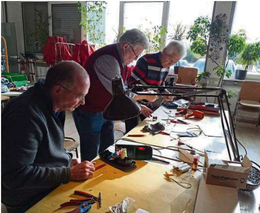
Die Reparatur-Spezialisten vom Repaircafé in der Tafel nehmen sich Zeit für die Behandlung von Geräten, die man wieder zum Laufen bringen kann – auch wenn' s mal knifflig sein sollte.

BAD SODEN (red) – Mit insgesamt mehr als 70.000 Euro fördert der Main-Taunus-Kreis im laufenden Jahr Bauvorhaben von Sportvereinen. Die Gelder werden als freiwillige Leistung des Kreises für Neu- und Umbauten, Sanierungen und Modernisierungen bewilligt, so die Stadtverwaltung. „Der Sport bringt nicht nur Leistungen auf dem Platz und in der Halle, er fördert auch den gesellschaftlichen Zusammenhalt“, so Landrat Michael Cyriax. „Die Förderung der Bauvorhaben ist auch eine Anerkennung für das enorme ehrenamtliche Engagement in den Vereinen, ohne das alles nicht möglich wäre.“ Gefördert werde in diesem Jahr in Bad Soden der Bau einer Tragflughalle des TC Blauweiß Bad Soden.