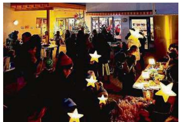
Lauschig war der Weihnachtsmarkt, den die Kita Sonnenschein zum zweiten Mal veranstaltet hatte.