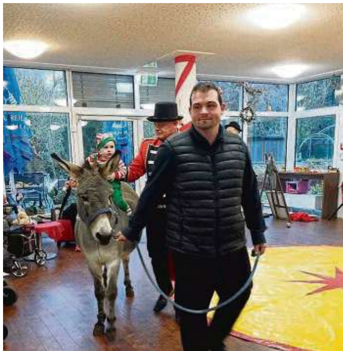
Früh übt sich: Beim Circus Barus ist mittlerweile die neunte Generation am Start.

„Alle unsere Standardtarife waren in diesem Jahr durchgehend unter der offiziellen Strom- und Gaspreisbremse“, berichtet das Unternehmen. Auch wenn die Tarife jetzt günstiger werden – beim Gas müssen die Kunden davon ausgehen, dass die Mehrwertsteuer ab März wieder auf 19 Prozent klettert. Die Regierung hatte sie auf sieben Prozent gesenkt, um die Verbraucher zu entlasten. Beim Strom betrug der Satz immer 19 Prozent. fm