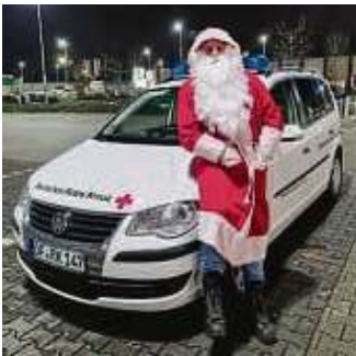
Der DRK-Nikolaus kam nicht mit dem Schlitten, sondern per Pkw.