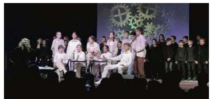
Stürmischen Applaus gab es für die etwa 50 Jugendlichen bei der Aufführung.

Getragen wurde das Ganze durch die Pianisten Klaus Cu-