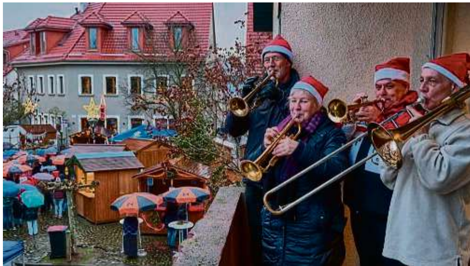
Vom Balkon des Gemeindehauses der Marktplatzgemeinde spielte der Posaunenchor mit Blick auf den Weihnachtsmarkt.

Neu-Isenburg – O du fröhliche Regentropfenzeit: So könnte man den Weihnachtsmarkt im Alten Ort in Neu-Isenburg beschreiben. Das unfreundliche Wetter trübte die Atmosphäre in den Altstadtgassen und auf dem Marktplatz. Beim Bummel unter Schirmen fiel die Verweildauer an Buden und Ständen deutlich kürzer aus als sonst. So fehlte die rege Betriebsamkeit mit unterhaltsamen Gesprächen. Aber nicht alle Besucher ließen sich die Freude am Weihnachtsmarkt verderben: Es gab auch einige „Wetterfeste“, die sich bei Glühwein erwärmten und sich eine original Thüringer „Roster“ schmecken ließen.