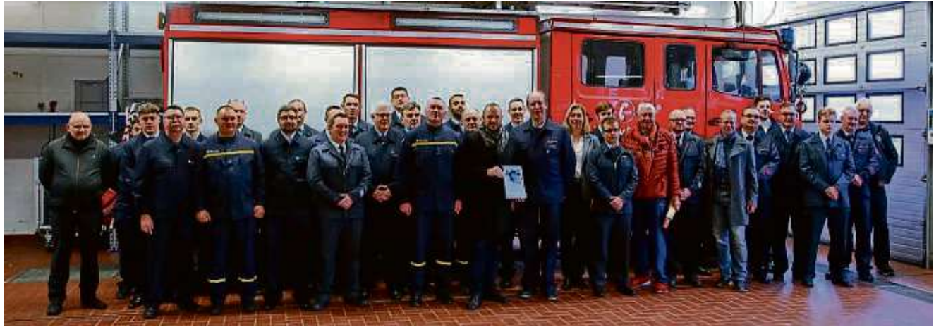
Bei der Übergabe des Tanklöschfahrzeugs 16/25 entstand dieses Gruppenbild mit den Feuerwehrleuten aus Ivanychi.

Unterstützung bei der Vermittlung kam auch vom Partnerschaftsverein Erzhausen und dem Erzhäuser Verein Vergiss-Mein-Nicht. red