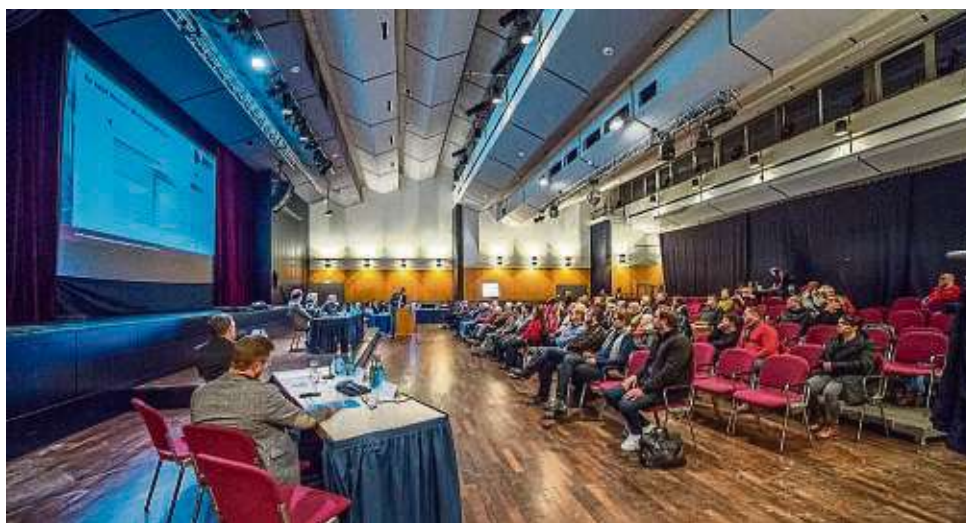
Wie kann die Wärmewende gelingen? Darum ging es in der Bürgerversammlung im Bürgerhaus, das im Übrigen mit Fernwärme geheizt wird.

Die Stadt hat sich gemeinsam mit den Stadtwerken bereits 2022 auf den Weg gemacht. Mit dem Erstellen des Plans ist die Energy Effizienz GmbH aus Lampertheim beauftragt worden. Ziel ist es, eine Infrastruktur für die Wärmeversorgung von einzelnen Quartieren oder Stadtteilen zu entwickeln. Heißt: Das Fachbüro untersucht, wo Haushalte und Unternehmen künftig durch Fern- oder Nahwärmenetze oder dezentrale Wärmelösungen wie Wärmepumpen versorgt werden können. Ein Beispiel: Wenn jemand in einem Gebiet lebt, das in naher Zukunft an ein Fernwärmenetz angeschlossen wird, muss er keine teure Wärmepumpe installieren. Über allem steht die Wärmeerzeugung