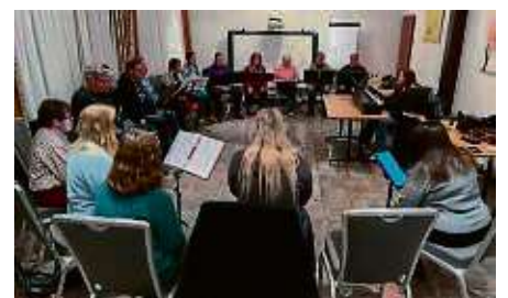
In Hösbach wurde fleißig geübt.

Der Kartenvorverkauf für das Konzert hat bereits begonnen. Karten sind erhältlich beim Reisebüro Thomaschautzki, bei Ludwig Tabakwaren, in der Poststelle Martin, sowie online auf gospelchor-bluelights.de. red