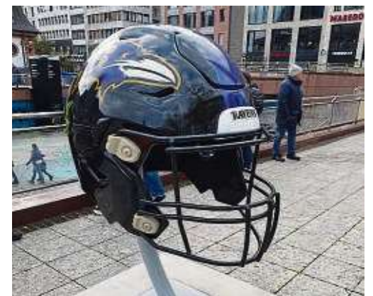
Mit den Frankfurt Games der NFL brach das Footballfieber aus.