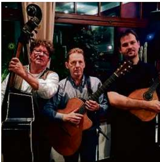
Die Shebeen Connection bringt „More than Irish Folk“ in die Frankfurt Art Bar.