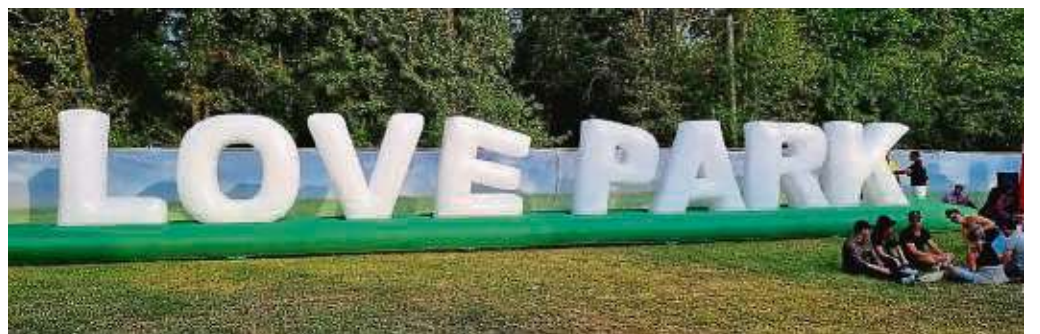
Beim Love Family Park 2023 tanzten 10.000 Menschen vor den Bühnen und lauschten der Musik der DJs in bunten und schrillen Outfits. Zum Chillen gab es unter anderem die Love-Park-Ecke.

im Vorjahr präsentieren und seinen Fans ein Line-up bieten, das im Umfang mit den früheren Love Family Parks vergleichbar ist oder diese sogar übersteigen wird. Die Programmplanung des Festivals steht seit 1996 für Qualität, Tradition und facettenreiches Booking. Die Fans erwarten auch 2024 ein Line-up, das alle Farben moderner elektronischer Musikarten widerspiegelt. Sven Våth als LFP-Legende hat sich für den Samstag angekündigt. Tickets für den Love Family Park zu ab 49 Euro gibt's online auf lovefamilypark.com/tickets .