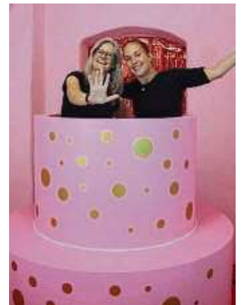
Das WochenBlatt ist fünf Jahre alt geworden – ein Grund zum Feiern.