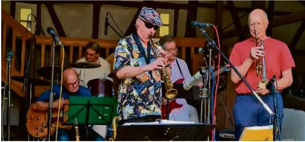
Die Hengstbach Jazz Crew hat sich nach dem Bächlein benannt, das durch alle fünf Ortsteile der Gemeinde Dreieich fließt.

Jede Menge Jazz in der Frankfurt Art Bar im Januar 2024