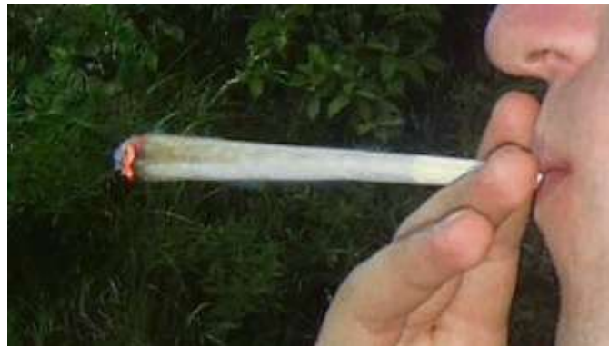
Immer weniger Jugendliche kiffen: Die Zahlen zu Cannabis scheinen – laut Studie – angesichts der Legalisierungsdebatte entwarnend.