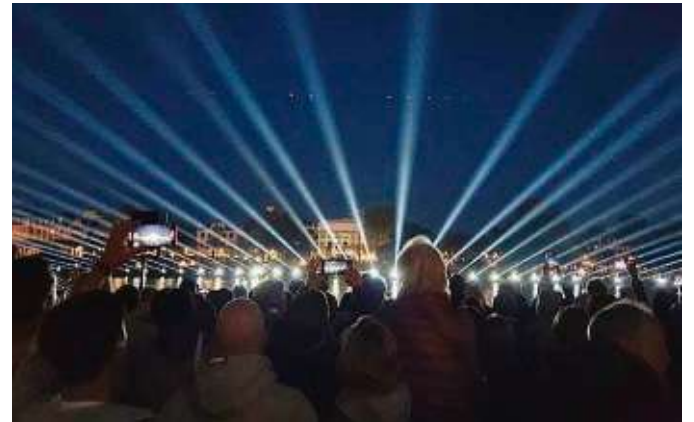
Frankfurt feierte den 175. Jahrestag des Zusammentretens der Nationalversammlung in der Paulskirche unter anderem mit einer Lichtshow.