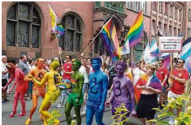
Endlich hat wieder der Christopher-Street-Day mit allem Drum und Dran stattgefunden: Für Gleichberechtigung und Respekt.