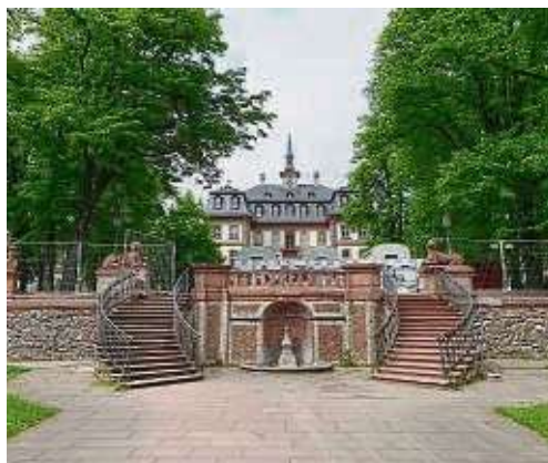
Mit der Tour durch Höchst endete die Stadtteilserie, die drei Jahre erfolgreich im WochenBlatt lief.