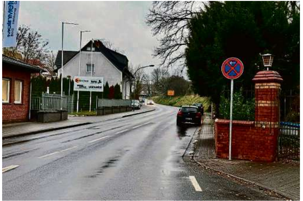
Parken nicht mehr erwünscht: Von nun an soll der Verkehr flüssiger laufen an der Ortszufahrt von Ravalzhausen.

Gemeinde reagiert auf zahlreiche Beschwerden