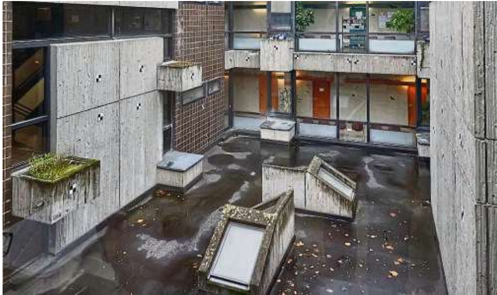
Der Lichthof im ersten Obergeschoss soll bepflanzt und als Ruhefläche genutzt werden.

Die Verteuerung des Verwaltungsbaus um neun auf 29 Millionen Euro war jedoch nicht der eigentliche Grund