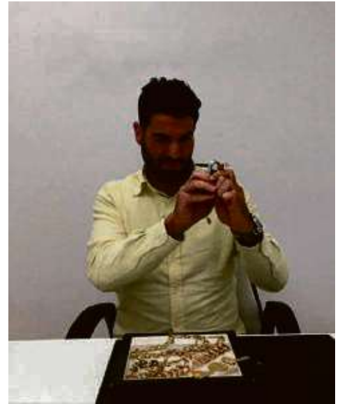
Ihr Spezialist für Goldankauf.