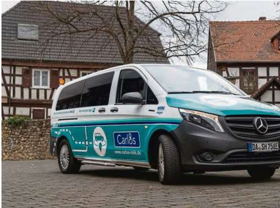
Die vollelektrischen On-Demand Shuttles können per App bestellt werden.

Die Betriebszeiten in beiden Bedienegebieten sind von Montag bis Donnerstag sowie an Sonn- und Feiertagen von 6 bis 22 Uhr. Freitag, Samstag sowie Montag bis Donnerstag vor Feiertagen