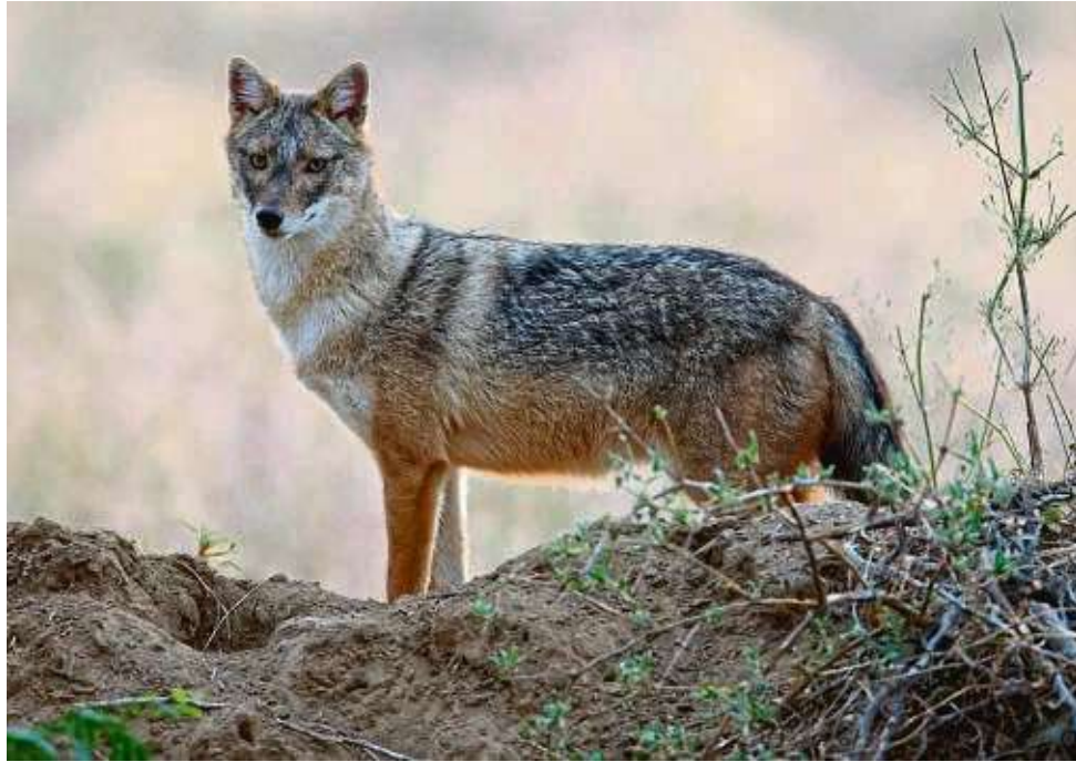
Goldschakale sind in Europa ursprünglich im Balkan beheimatet, breiten sich aber zunehmend in neuen Gebieten aus.

Es sei durchaus möglich, dass der Schakal erst nach deren Tod an ihnen gefressen hat. Denn gleichzeitig mit der DNA des Goldschakals seien auch genetische Spuren von Füchsen an den toten Tieren nachgewiesen worden. Bei den getöteten Tieren handelte es sich um Kamerschafe, die eine vergleichsweise kleine Schafrasse darstellen und sowohl von Füchsen als auch von einem Goldschakal überwältigt werden