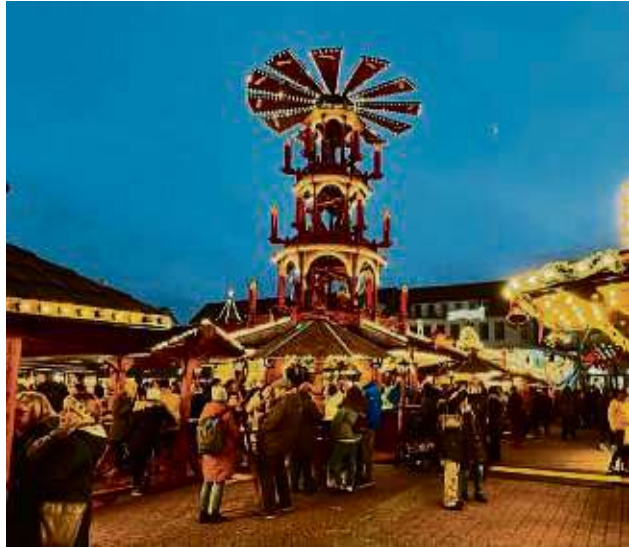
Der Hanauer Weihnachtsmarkt zählt zu den schönsten in Hessen. Dieses Jahr war er allerdings nicht so stark frequentiert wie zuvor.