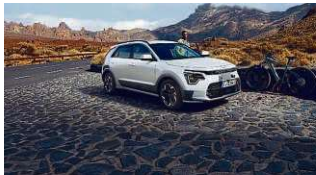
Kia gewährleistet Privatkunden die volle Förderung für E-PKW's nach den bisherigen Konditionen und erweitert ihre Prämiegarantie auf das erste Quartal 2024.

Weitere Informationen zum Kia-Umweltbonus sowie den geförderten Modellen bei Weber Automobile, Martin-Luther-King-Straße 10, Hanau, z 06181 98090. ari