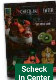
Scheck In Center