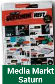
Media Markt Saturn

Sie haben Prospekte? Wir verteilen sie für Sie!