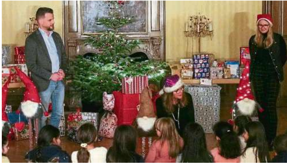
Groß war die Freude bei den rund 30 Mädchen und Jungen, die zur Bescherung in den großen Saal des Schlosses gekommen waren.