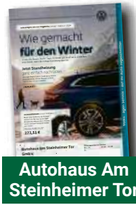
Autohaus Am Steinheimer Tor