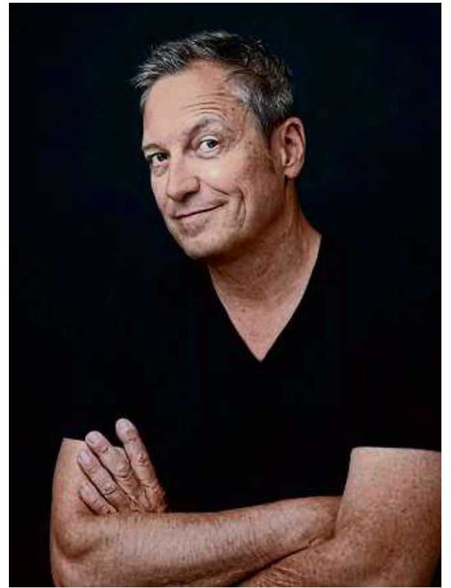
Dieter Nuhr kommt mit seinem neuesten Programm in die August-Schärttner-Halle.

Die feine Ironie des gebürtigen Weselers paart sich gerne mit grobem Unverständnis. Seine Fassungslosigkeit über den Zustand der Welt verarbeitet er mit Sarkasmus. Bei Nuhr entlädt sich die Lächerlichkeit des Daseins in einem sagenhaft witzigen Ideenfeuerwerk. Seine Satire basiert auf Beobachtung, Staunen und Zünde-Denken. Er nimmt sein Publikum mit auf eine höchst amüsante Reise durch ernste Zeiten. Und wenn er die Gegenwart seziert, schauen alle hin. Die täglich wechselnde Aktualität und die immer neuen Säue, die durchs Dorf