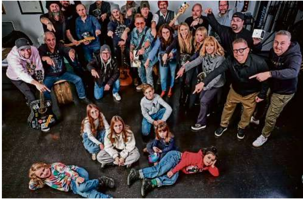
Wenn die Akteure der Gruppe Hautevolee zusammen in Aktion treten, dann tun sie das, um sich für Kinder zu engagieren.

Im vergangenen Jahr wurden bei der Aktion 20400 Euro eingespielt, in Spitzenzeiten vor der Pandemie seien es sogar einmal 28000 Euro gewesen. Einnahmen dieser Größenordnung wünscht sich der