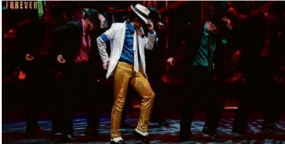
Der King of Pop steht im Mittelpunkt des Tribute-Konzerts in der Alten Oper Frankfurt.

Hanau – Es ist wenig erstaunlich, dass Fans von Musikgrößen so gerne auf Konzerte gehen. Da ist ihr Star nicht nur zum Greifen nah. Dort hören sie ihn live, spüren seine Ausstrahlung und die Stimmung im Saal, genießen die persönliche Ansprache, bekommen quasi das Gesamtpaket aufgetischt mit Show und Mitmacheinlagen fürs Publikum. Kein Wunder also, dass sich Tribute-Konzerte verstorbener Künstler so großer Beliebtheit erfreuen. Besonders dann, wenn die Coverband so gut ist, dass man sie kaum vom Original unterscheiden kann. Mit „Forever – The best Show about Michael Jackson“ bieten jetzt der HANAUER ANZEIGER und die Konzertagentur Shooter Promotions den Lesern wieder eine Konzertfahrt nach Frankfurt, die ein solches Erlebnis verspricht: Am Dienstag, 12. März 2024, geht es vom Verlagsgebäude an der Donaustraße zur Alten Oper nach Frankfurt, wo ab 20 Uhr der 2009 verstorbene King of Pop wiederauferstehen und mit einer 20-köpfigen Gruppe von Tänzern und Sängerinnen eine unvergessliche Show