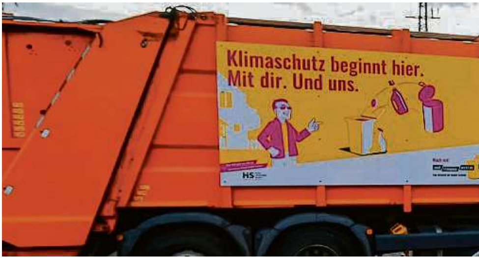
Auf drei Müllfahrzeugen sind die Banner zu finden.