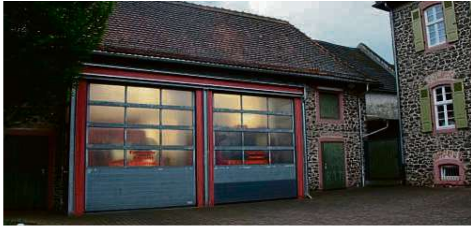
Die bestehende Feuerwehrwache in Oberdorfelden ist nicht mehr zeitgemäß und wird bald ersetzt. Im Ortsbeirat wurde die Nachnutzung diskutiert.

benachbarten Nidderhalle den Geist aufgegeben hatte, sei über eine gemeinsame Anlage nachgedacht worden, so Brey. Da aber beim neuen Feuerwehrgerätehaus eine Wärmepumpe und Fußbodenheizung zum Einsatz kommen sollen, und die Nidderhalle für solch eine Beheizung nicht geeignet ist, wurde dieser Plan wieder aufgegeben.