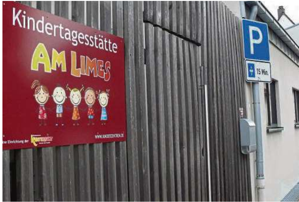
Die Kita am Limes bietet Platz für bis zu 62 Kinder in drei Gruppen.