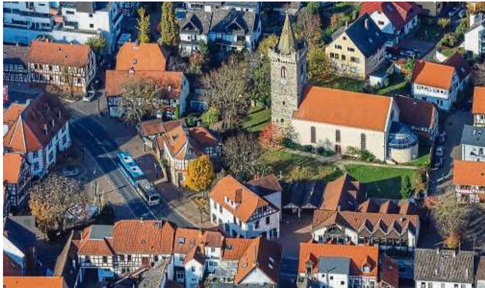
Das Leben in Bruchköbel soll teurer werden: Angesichts steigender Abgaben will die Verwaltung nun ihrerseits die Steuern anheben.

Laut Verwaltungsentwurf soll die Grundsteuer B von derzeit 530 auf 590 Punkte steigen. Davon sind nicht nur die Eigentümer von Häusern, sondern auch Mieter betroffen, weil die Grundsteuer zu meist von den Vermietern umgelegt wird. Auch Unternehmen müssen sich auf Mehrabgaben einstellen. So wird die Grundsteuer A laut Verwaltungsentwurf von 388 auf 500 Punkte steigen. Der Gewerbesteuerersatz soll ebenfalls angehoben werden: von derzeit 390 auf 420 Punkte. Zur Abstimmung steht der Haushalt am 12. März kommenden Jahres. Vorab wird das Zahlenwerk noch im Parlament im Rahmen zweier Sitzungen des Haupt- und Finanzausschusses diskutiert. Dass das Parlament der Empfehlung der Verwaltung folgt, ist jedoch aufgrund der politischen Konstellation im Stadtparlament sehr wahrscheinlich. Begründet wird die Steuererhöhung in einer Pressemitteilung vor allem durch zwei Faktoren. Zunächst ma-