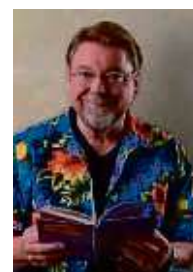
Jürgen von der Lippe Entertainer

Hanau – Geschichten und Glossen von Komiker, Musiker, Autor, Entertainer, kurzum dem Allroundtalent Jürgen von der Lippe werden vom Autor selbst am Dienstag, 20. Februar 2024, im Congress Park Hanau (CPH) zum Besten gegeben.