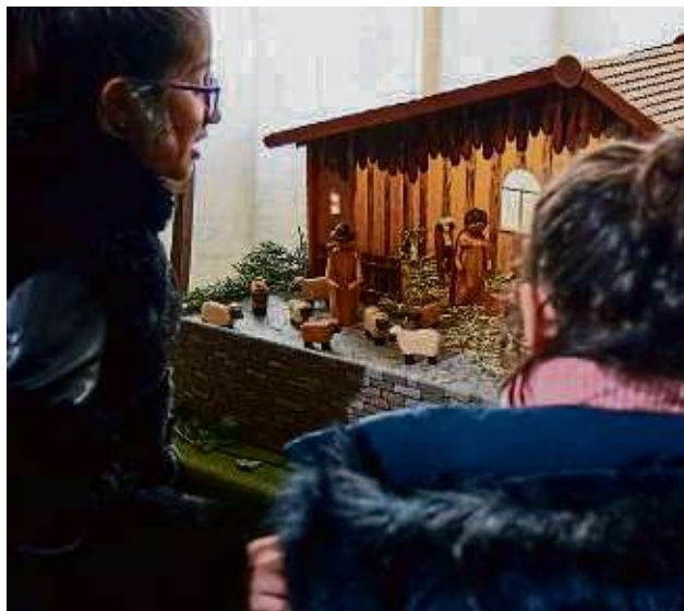
Kinder der Friedrich-Ebert-Schule in Klein-Auheim haben das Museum Radwerk besucht und die vielen Krippen der Sonderausstellung betrachtet.

Für manch einen gehört sie zu Weihnachten wie der ge-