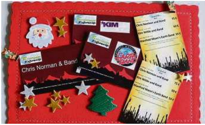
Tickets fürs Open-Air als Weihnachtsgeschenk.