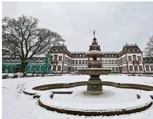
Das Museum Philippsruhe lädt „Zwischen den Jahren“ zum Besuch ein.

Kinder und Jugendliche bis 18 Jahren haben im Historischen Museum Hanau Schloss Philippsruhe, im Museum Schloss Steinheim und im Museum Großauheim kostenfreien Eintritt. das