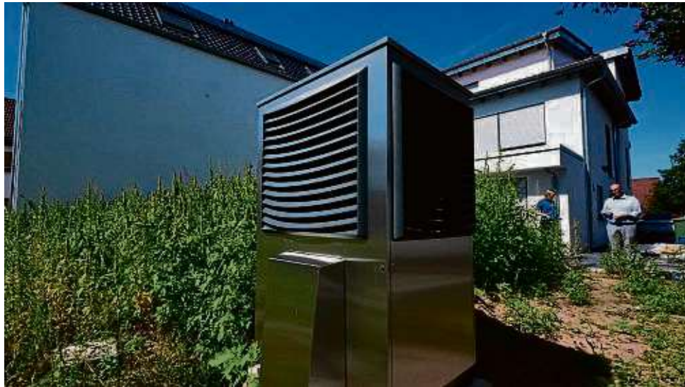
Die Wärmeplanung soll unter anderem Strategien und Maßnahmen zur Gewinnung erneuerbarer Energien aufzeigen. Wärmepumpen wie diese gelten dabei als vielversprechende Technologie für Hausbesitzer.

Mit Blick auf die Kosten empfiehlt Greuel, den Antrag auf Fördermittel bis zum 31. Dezember einzureichen – trotz der aktuellen Debatte