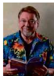
Jürgen von der Lippe Entertainer

Hanau – Geschichten und Glossen von Komiker, Musiker, Autor, Entertainer, kurzum dem Allroundtalent Jürgen von der Lippe werden vom Autor selbst am Dienstag, 20. Februar 2024, im Congress Park Hanau (CPH) zum Besten gegeben.