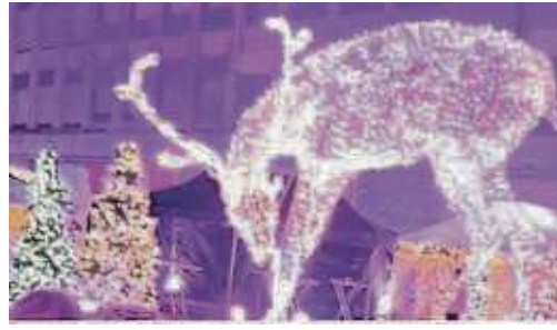
Das Rentier an der Stiftstraße wurde häufig als Hintergrund für Selfies genutzt.