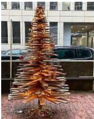
Der Christbaum aus Europaletten.

Innenstadt (red) – „Hausmeister Krause: Du lebst nur zweimal“ von Tom Gerhardt und Franz Krause wird in der Komödie, Neue Mainzer Straße 14-18, gespielt. Bis 4. Februar heißt es: Alarm! Der notorische Unruhestifter Dieter Krause (Tom Gerhardt) ist wieder da – mit einem großen Drama. Nachdem der bockbeinige und stets übermotivierte Hausmeister ein Jahrzehnt im TV seine Mitmenschen gequält hat, drängt er auf die Bühne. Natürlich mit seiner bildungsfernen Familie und dem unvermeidlichen Dackelklub. Krause hat einen höllischen Rosenkrieg mit seiner Lisbeth: Hatte er doch wieder einmal den Hochzeitstag vergessen und nur seine Präsidentschaft im Teckel-Verein im Sinn. Karten zu ab 20 Euro und alle Spieltermine stehen online auf diekomoedie.de .