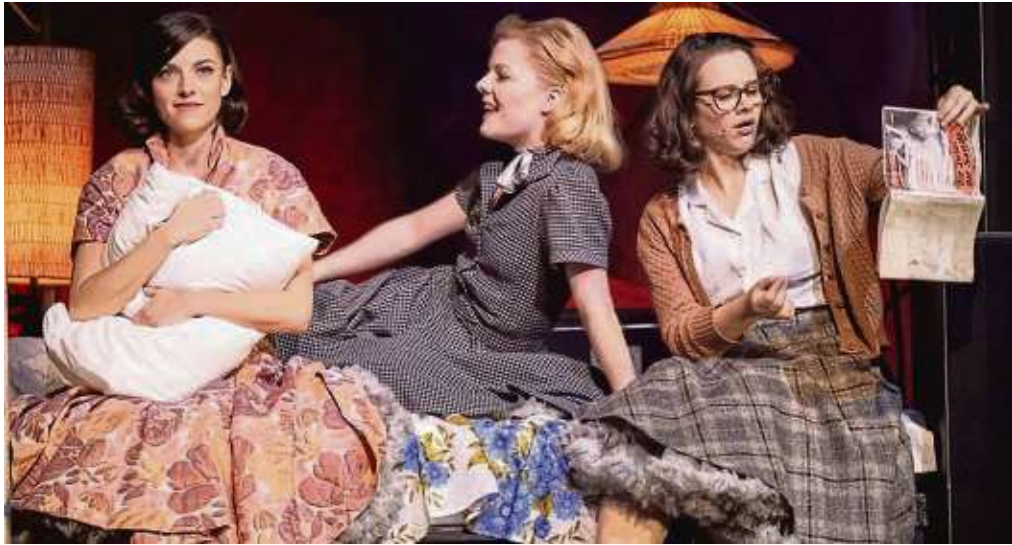
Die Schwestern Helga, Eva und Monika träumen von einer freieren Zukunft.