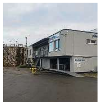
Im Shop auf dem RMB-Gelände wird Kompost verkauft.

tungspapier, empfiehlt er. Die Kompostklumpen werden schließlich noch mal abgesiebt. Auf dem Hof türmt sich ein beeindruckender Berg des Endergebnisses: Tiefschwarzer feiner Kompost, auf dem wieder neue Pflanzen sprießen können – die auf lange Sicht wieder im Biomüll landen sollten.