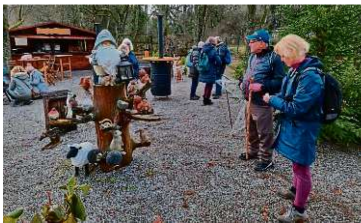
Die Wanderer der Tus Schwanheim auf ihrem Weg in den Odenwald.

Der festlich beleuchtete Weihnachtsmarkt im Schlossgarten fügt sich wunderbar in die Altstadt ein und mit weihnachtlicher Musik des Blasorchesters schmeckten die hausgemachten Kartoffelpuffer und der Glühwein besonders lecker. Nach ei-