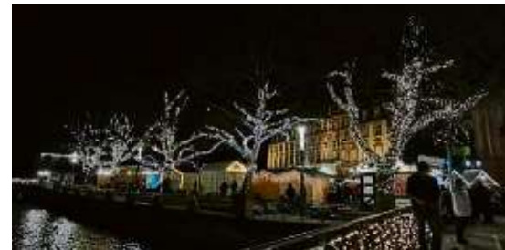
Eine tolle Belohnung: Der Ausblick am Ziel.

Die nächsten Wanderungen stehen an den Samstagen, 20. sowie 27. Januar 2024, an. Die Tus Schwanheim freut sich auch immer über Gäs-