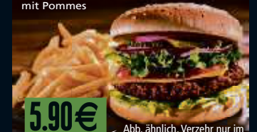
Abb. ähnlich. Verzehr nur im Restaurant. Preis pro Person.

*Unverbindliche Preisempfehlung des Herstellers