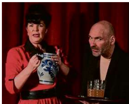
„Das Spukhaus an der Nidda“ wurde auch schon im Theater Lempenfieber aufgeführt.