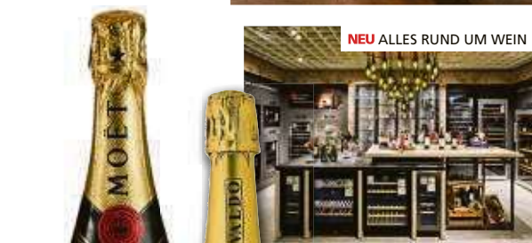
NEU ALLES RUND UM WEIN