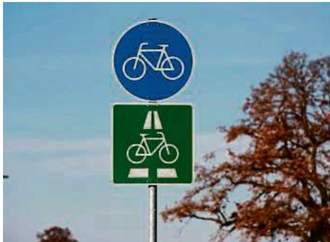
Der FRM6 ist in Planung.

Laut Machbarkeitsstudie verläuft die Vorzugstrasse des Radschnellwegs von Butzbach über Ober-Mörlen, Bad Nauheim, Friedberg, Wöllstadt, Karben und Bad Vilbel bis nach Frankfurt. Der Verlauf dieser Trasse wurde in der Studie bilateral mit den beteiligten Kommunen abgestimmt. Das Besondere: Die Vorzugstrasse verläuft überwiegend auf bestehenden Verkehrswegen, eine Neutrassierung ist daher zumeist nicht erforderlich. Mit seiner Länge von 46,2 Kilo-