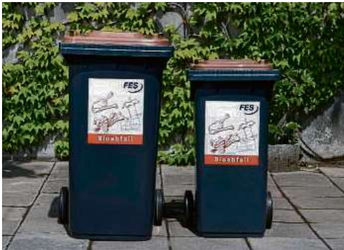
Mülltrennung als guter Vorsatz: Die FES listet auf, was alles in die Biotonne reingehört.

Fechenheim/Griesheim (red) – „Die Natur kennt keine Abfälle“, weiß man bei der Frankfurter Entsorgungs- und Service GmbH (FES). Aus Biomüll wie Küchen- und Gartenabfällen wird bei Rhein Main Bio-kompost (RMB), einer Tochter der FES, aus Biomüll Kompost hergestellt. „Die Kompostierung ist das älteste und einfachste Recyclingverfahren überhaupt“, führt die FES weiter aus. Um die Mitbürger zu motivieren, wertvollen Biomüll zu sammeln, hat die FES eine Challenge zwischen Fechenheim und Griesheim gestartet, die bis Mai 2024 läuft und bei der ermittelt wird, welcher Stadtteil beim Biomüll-Sammeln die Nase vorn hat (wir berichten). Doch viele Mitbürger sind sich nicht sicher, was denn eigentlich in die braune Biomülltonne reindarf. Für eine sinnvolle Wiederverwertung des Bioabfalls ist die getrennte Sammlung bereits am Entstehungsort eine wichtige Voraussetzung. Etwa ein Viertel des Hausmülls besteht aus organischen Abfällen, die gesammelt und kompostiert werden können. Ein Tipp der FES: „Feuchte Bioabfälle und Fleischabfälle aus der Küche sollten in Zeitungspapier eingeschlagen werden. Dadurch wird die Feuchtigkeit aufgesaugt und eine Geruchsentwicklung minimiert.“ Was gehört denn nun alles in die Biotonne?