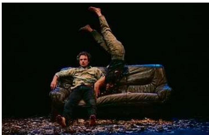
Das Festival „Winterwerft“ steht dieses Mal unter dem Motto „Bodenlos – Losing Ground“.

Im Fokus stehen Fragen zu Krise, Utopie und Dystopie – und wie das Theater helfen kann, sich diesen Themen anzunähern. Das Festival greift sich in diesem Sinne auch als Schauplatz von Dialogen um Nachhaltigkeit, Resilienz und Gemeinschaft sowie als ein Ort, an dem durch kritisches Hinterfragen ein Perspektivwechsel gewagt werden soll. Es wird darum gehen, Ausbeutungsstrukturen und koloniales Erbe zu hinterfragen und auf die Suche nach einem nachhaltigen Umgang mit Lebensgrundlagen zu gehen.