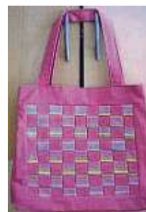
So eine Meshwork-Tasche ist ein toller Hingucker.

Workshop „Meshwork-Tasche“ für Nähanfänger an. Mittels Flechttechnik entstehen aus Stoffstreifen hü-