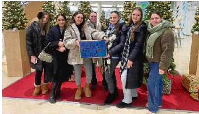
Die Gruppe aus der R10 der Schule am Ried machte beim Projekt der „Stützenden Hände“ mit.

Die Schule am Ried war dieses Jahr ein Teil des Projekts. Dafür hatte der Wahlpflicht-Kurs R10b von Sümeyye Sagir-Yazici viele Plätzchen gebacken, sodass zuzüglich der Geschenke insgesamt 150 Plätzchentüten für das Projekt gespendet