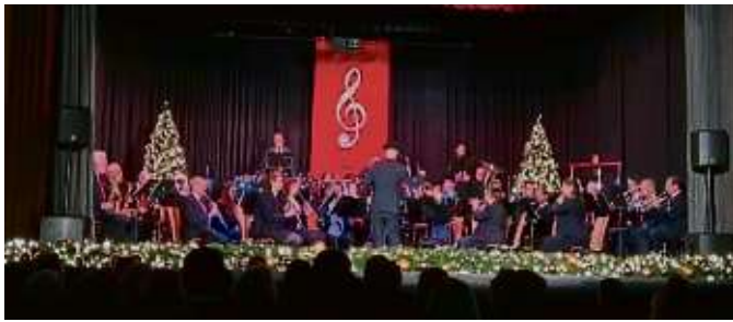
Die Stadtkapelle Bergen-Enkheim setzte mit ihrem Weihnachtskonzert festliche Höhepunkte.

Bergen-Enkheim (red) – Die Stadtkapelle Bergen-Enkheim begeisterte mit ihrem traditionellen Weihnachtskonzert – dargeboten von 35 Musikern unter der musikalischen Leitung von Jakob Kufert – die rund 300 Besucher im Volkshaus Enkheim.