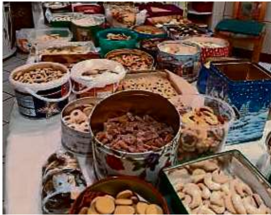
Eine große Auswahl an Plätzchen ist in der Landfrauen-Küche gebacken worden.

Bergen-Enkheim (red) – Genau 49 Bäckerinnen sorgten in diesem Jahr für ein breit gefächertes Angebot an Plätzchen für den Weihnachtsmarkt in Bergen-Enkheim. Die Plätzchen waren, wie auch das Angebot an selbst hergestellten Marmeladen, Likören und anderen Leckereien, wieder Publikumsmagnet am Stand der Landfrauen in der Nikolauskapelle. Das reichhaltige Angebot schnell regen Absatz. Die Landfrauen freute es, auch in diesem Jahr die lieb gewonnene Tradition unterstützt zu haben