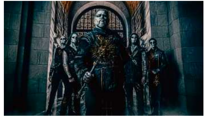
Die Metaller von Powerwolf kommen im nächsten Jahr für ein Konzert in die Frankfurter Festhalle.