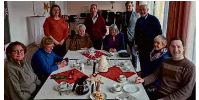
Beim Weihnachtscafé der Bergen-Enkheimer SPD wurde auch über Wahlergebnisse gesprochen.

nisse der Wahlen wurden sehr unterschiedlich bewertet. Die Wahl von Mike Josef zum neuen Frankfurter Oberbürgermeister wurde als riesiger Erfolg bewertet, mit dem vorher nur wenige gerechnet hatten. „Das Ergebnis der Landtagswahl war hingegen für die SPD eine große Enttäuschung und die Genossinnen und Genossen waren sich einig, dass hier auf Landesebene, auch im Falle einer möglichen Regierungsbeteiligung, ein Erneuerungsprozess stattfinden muss“, heißt es dazu von den Bergen-Enkheimer Sozialdemokraten. Nach dem ereignisreichen Jahr gehe es nun darum,