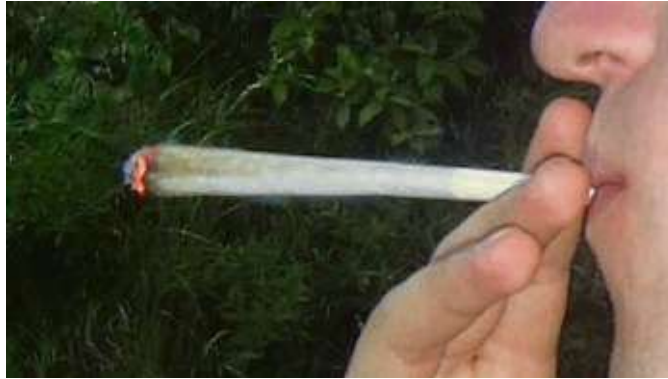
Immer weniger Jugendliche kiffen: Die Zahlen zu Cannabis scheinen – laut Studie – angesichts der Legalisierungsdebatte entwarnend.

gewesen. Das sind jeweils die zweitniedrigsten Werte seit Beginn der Erhebung. Nur im Corona-Jahr 2020 wurde weniger konsumiert. Der seit einigen Jahren zu beobachtende rückläufige Trend beim Alkoholkonsum hat sich in der aktuellen Erhebung weiter fortgesetzt.