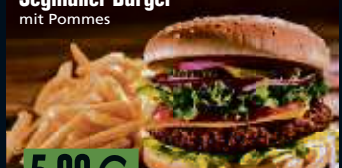
Abb. ähnlich. Verzehr nur im Restaurant. Preis pro Person.

*Unverbindliche Preisempfehlung des Herstellers