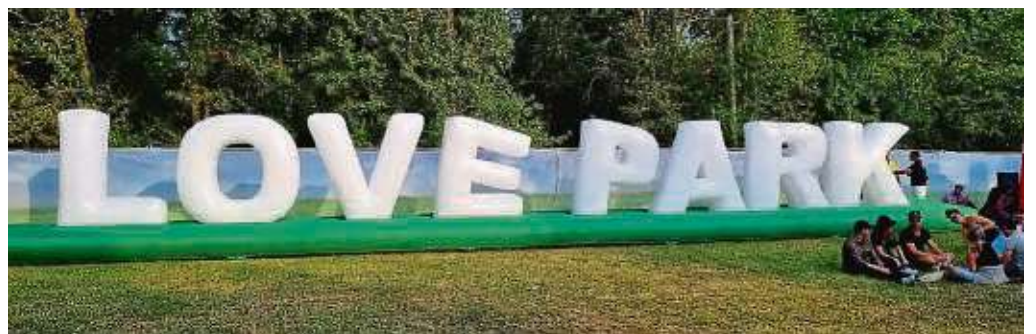
Beim Love Family Park 2023 tanzten 10.000 Menschen vor den Bühnen und lauschten der Musik der DJs in bunten und schrillen Outfits. Zum Chillen gab es unter anderem die Love-Park-Ecke.

im Vorjahr präsentieren und seinen Fans ein Line-up bieten, das im Umfang mit den früheren Love Family Parks vergleichbar ist oder diese sogar übersteigen wird. Die Programmplanung des Festivals steht seit 1996 für Qualität, Tradition und facettenreiches Booking. Die Fans erwarten auch 2024 ein Line-up, das alle Farben moderner elektronischer Musikarten widerspiegelt. Sven Väth als LFP-Legende hat sich für den Samstag angekündigt. Tickets für den Love Family Park zu ab 49 Euro gibt's online auf lovefamilypark.com/tickets .