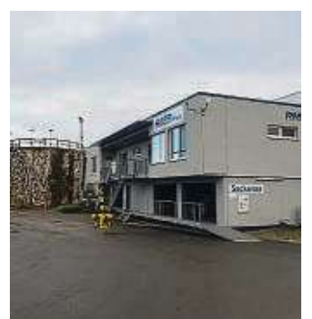
Im Shop auf dem RMB-Gelände wird Kompost verkauft.

tungspapier, empfiehlt er. Die Kompostklumpen werden schließlich noch mal abgesiebt. Auf dem Hof türmt sich ein beeindruckender Berg des Endergebnisses: Tiefschwarzer feiner Kompost, auf dem wieder neue Pflanzen sprießen können – die auf lange Sicht wieder im Biomüll landen sollten.