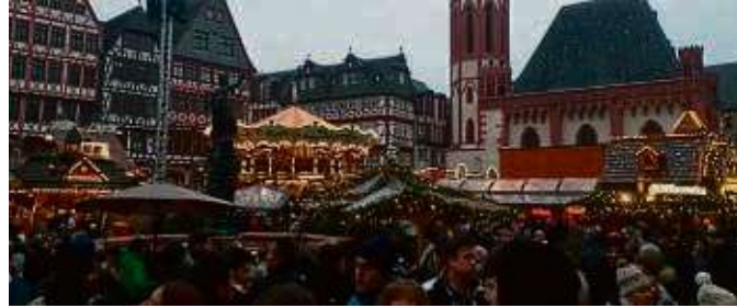
Justitia wachte über die Weihnachtsmarkt-Besucher in der Altstadt.