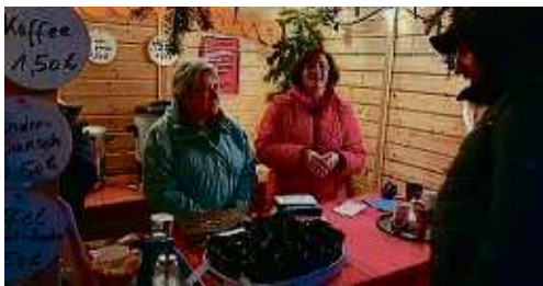
Kaffee, Punsch und Waffeln gab's in Fechenheim.