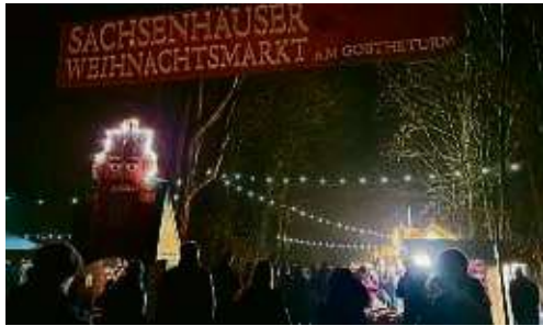
Weihnachtliches Treiben herrschte rund um den Goetheturm in Sachsenhausen.