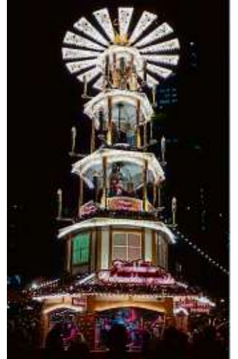
Die Pyramide am Roßmarkt.