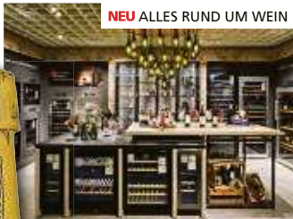
NEU ALLES RUND UM WEIN