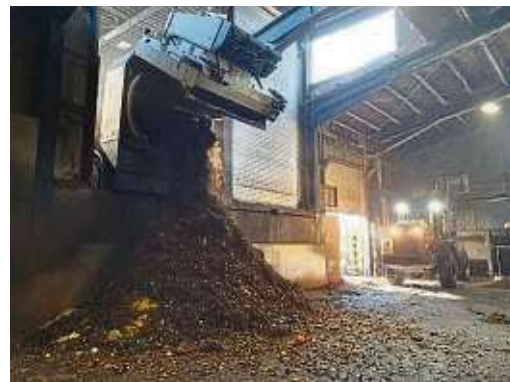
Der Biomüll fällt aus dem Sammelfahrzeug von der Laderampe in die Annahmehalle.

Für die Gärreste geht es nun in die Kompostierung, wo der strukturreiche Abfall wie Grünschnitt schon direkt – ohne Vergärungsprozess – gelandet ist. Die Kompostierung findet in 17 Rottentunneln statt. Durch gezielte Frischluftzufuhr finden die für die Kompostierung zuständigen Mikroorganismen optimale Bedingungen vor. Deshalb ist der Vorgang, der normalerweise drei Monate dauert, bereits nach zwölf Tagen abgeschlossen. „Deswegen sind auch die im Handel angebotenen biologisch abbaubaren Kunststoffbeutel für Biomüll nicht geeignet. Die zwölf Tage reichen nicht, um den Beutel vollständig zu zersetzen“, sagt Dumin. Ideal zum Einwickeln von Bioabfällen sei Zei-