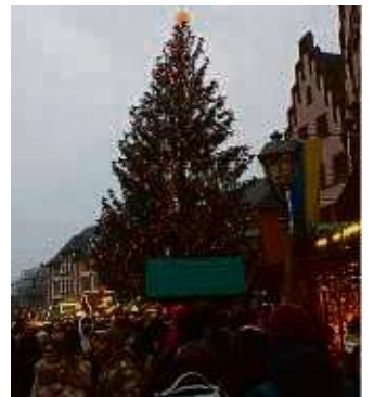
Der Weihnachtsbaum inmitten der Buden und des Lichterglanzes.