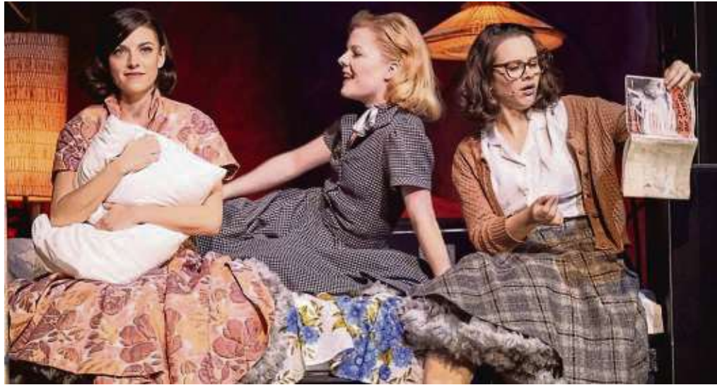
Die Schwestern Helga, Eva und Monika träumen von einer freieren Zukunft.