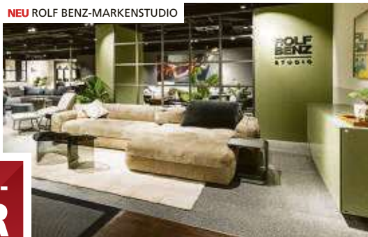
NEU ROLF BENZ-MARKENSTUDIO