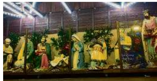
Die Krippe stand wie immer auf dem Römerberg.