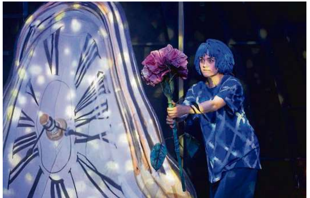
Momo bringt den Menschen die gestohlene Zeit zurück.

Die „Grauen“ setzen die Menschen unter Druck, ihnen ihre eingesparte Zeit zu überlassen. Die Menschlichkeit geht fast vollständig verloren, während die qualmenden, fiesen „Grauen“ die Zeit der Bürger in sich aufsaugen und so existieren