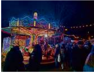
In Bergen-Enkheim drehte sich ein buntes Karussell.

Nun ist es an der Zeit, Weihnachten zu feiern – mit den Liebsten eine wundervolle Zeit zu verbringen, sich zu besinnen auf das Wichtige im Leben und zum Jahresende mal wieder richtig zur Ruhe zu kommen. Die Redaktion des Frankfurter WochenBlatts wünscht in diesem Sinne allen Lesern, Kunden, Austrägern, Freunden und Wegbegleitern ein friedvolles, aber auch interessantes, ein entspanntes, aber auch lustiges sowie fröhliches, glückliches und gesundes Weihnachtsfest!