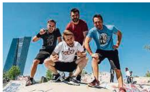
Alex im Westerland rocken die Kapp.

Seckbach (red) – Der Witz und der Charme von den Ärzten, die Energie und Spielfreude der Toten Hosen: Diese Zutaten zu einer explosiven Rockshow zu kombinieren, das Beste aus zwei Welten zu vereinen, auf dieser Mission befindet sich die Band Alex im Westerland. Ein Konzert spielt die Coverband in der Batschkapp, Gwinnerstraße 5, am Freitag, 29. Dezember, ab 19.30 Uhr. Unterstützt werden sie dabei von Smells like Nirvana – a Tribute to Nirvana und Blink Day – Blink 182/Green Day Tribute und einem special Guest. Die vier Frankfurter von Alex im Westerland rocken sich ganzjährig durch Klubs, Festivals, Stadt-